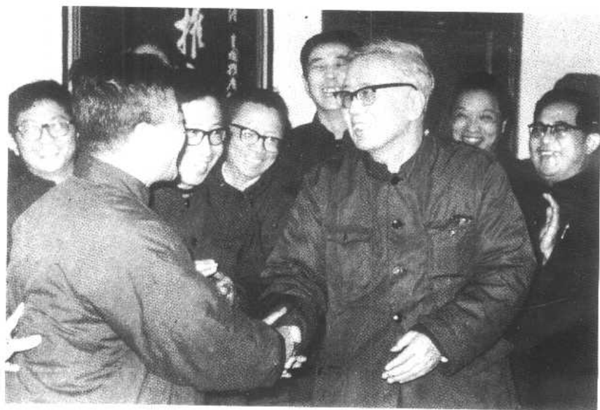
华罗庚第一次参加党员支部大会。(1979年)