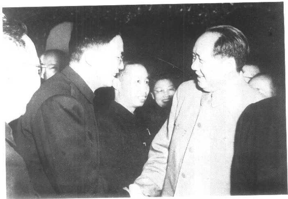
与毛泽东在一起。(1958年)