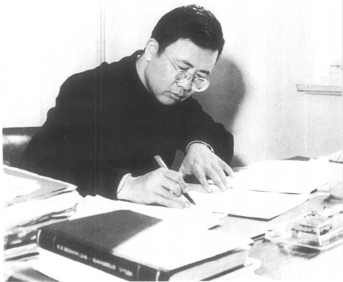
华罗庚在聚精会神工作