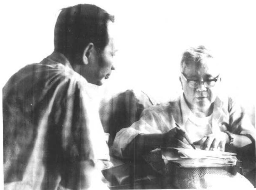
与本书作者在一起。（1980年）