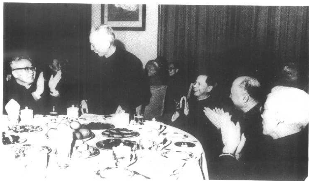
在宴会上。左起华罗庚、王震、方毅、钱学森、周培源。(1980年)