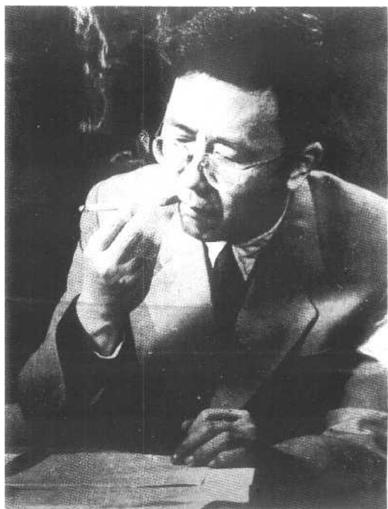
沉思在数学王国中。 (1955年)