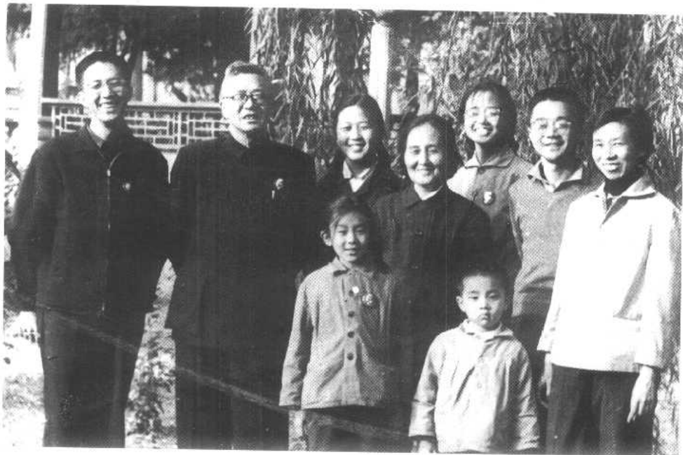
文革中华罗庚与部分家人合影。左起华陵、华罗庚、华光、 吴筱元、华苏、华俊东、柯小英，前排为华罗庚的孙子与孙女。