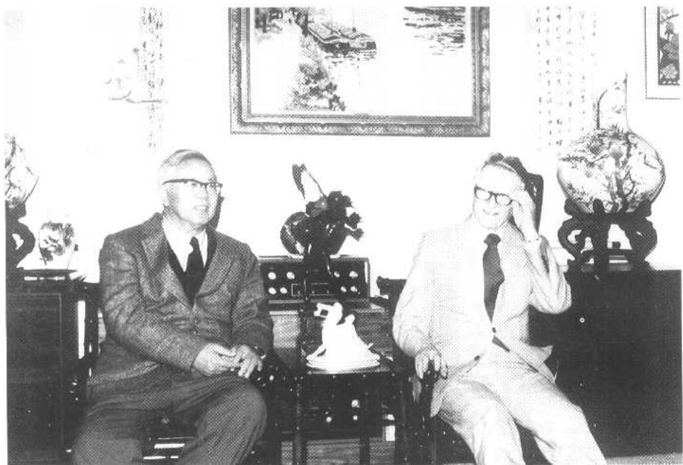
与赛尔贝格在一起。(1981年)