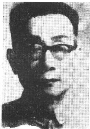
熊庆来(迪之)先生 (1893~1969年)