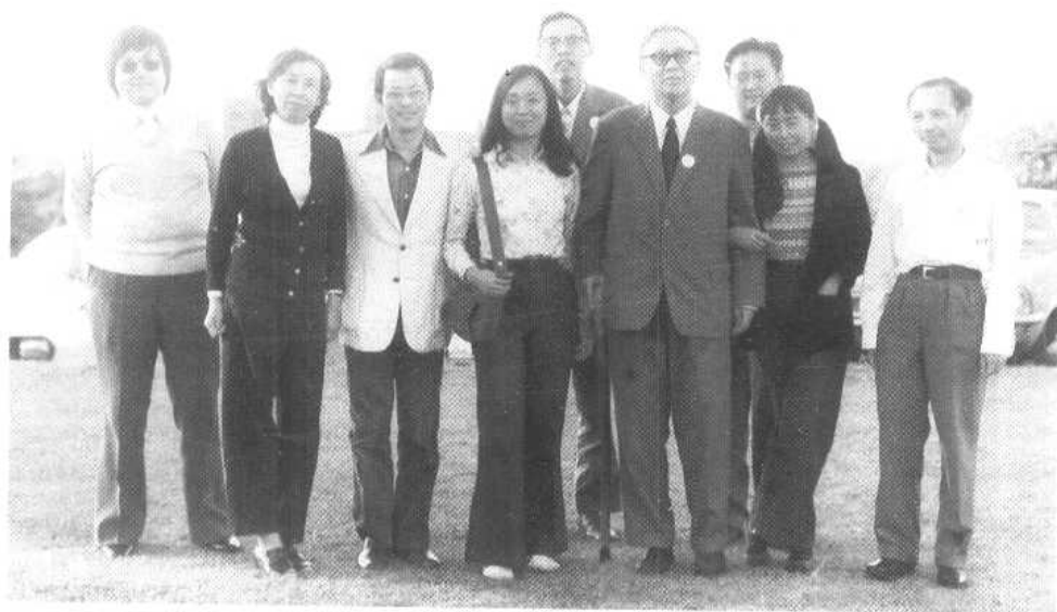
在英国国际数论讨论会上。(1979年)