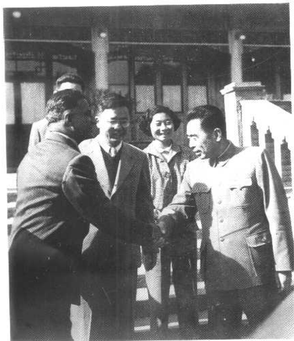
与周恩来在一起。左一为 印度数学家高善必。(1958年)