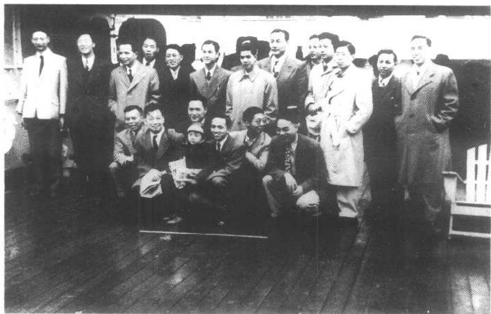
回国轮船上。后排左二华罗庚,左三程民德。(1950年)