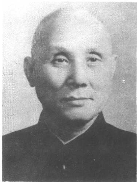
邓 子 恢