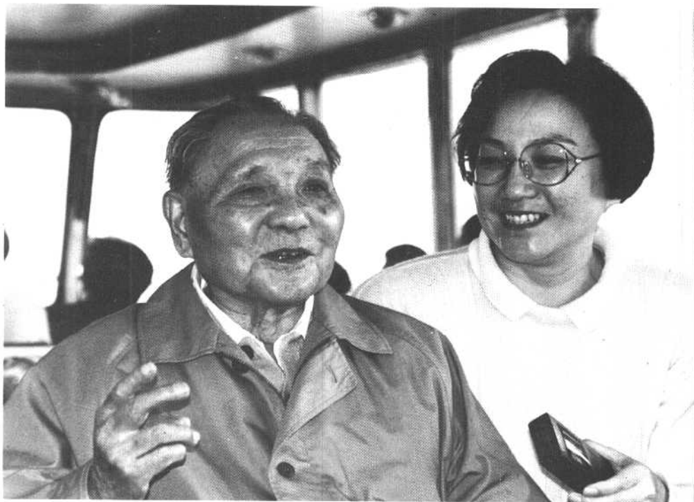
1993年初，我陪父亲在杭州。