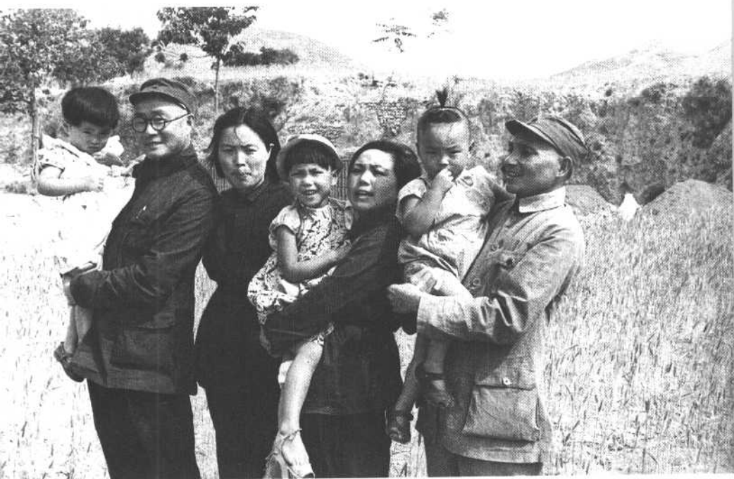
1945年，父亲、母亲抱着我的哥哥、姐姐与刘伯承伯伯、汪荣华阿姨一家合影。