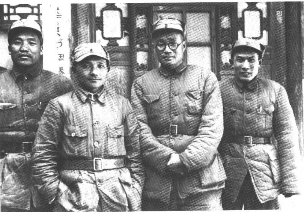
1938年1月，我父亲任八路军129师政治委员。 这是129师领导人在山西辽县（今左权县）桐峪镇合影。 左起：李达、我父亲、刘伯承、蔡树藩。