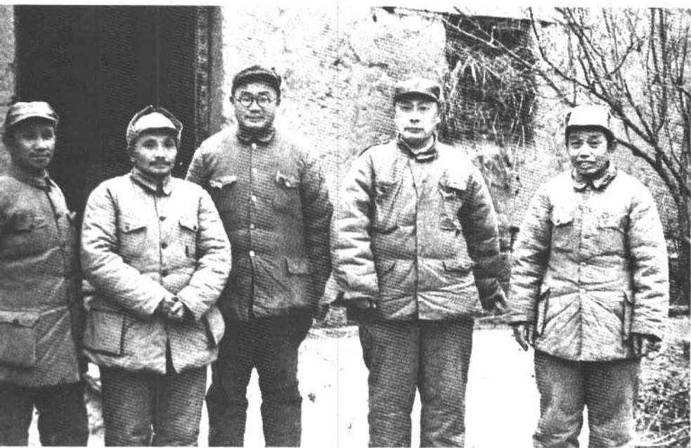
1948年11月，中共中央革命军事委员会决定成立五人总前委，统一领导和指挥中原、华东两大野战军，我父亲任总前委书记。这是总前委成员合影。左起：粟裕、我父亲、刘伯承、陈毅、谭震林。