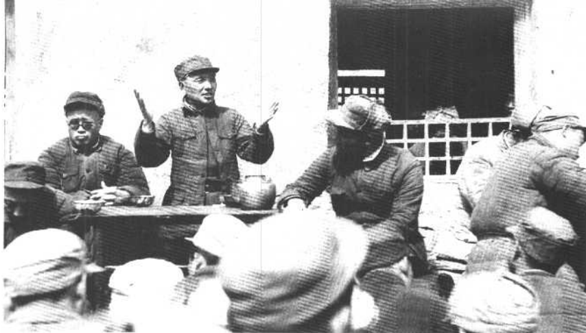
解放战争期间，晋冀鲁豫野战军在紧张作战的同时，开展了整党和新式整军运动。这是我父亲在作动员报告。