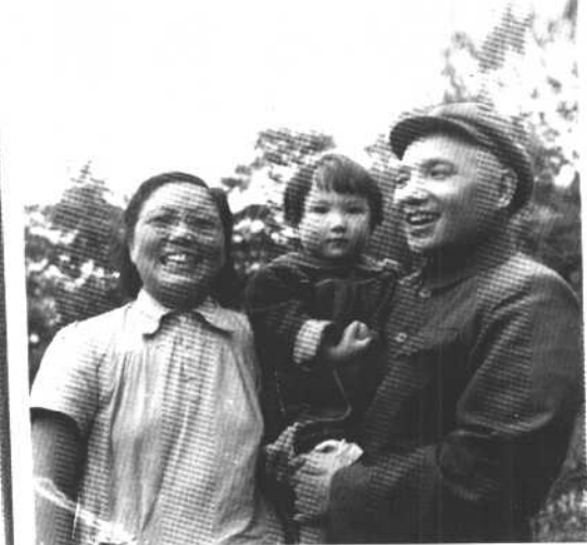
五十年代初，父亲、母亲和我在一起。