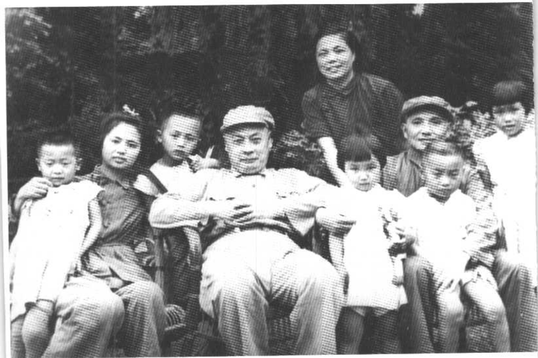
上海解放后，我父亲、母亲和陈毅伯伯、张茜阿姨带着孩子们在一起。