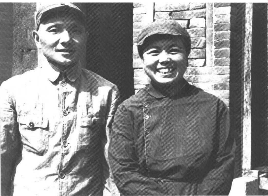
我的父亲和母亲在太行山。