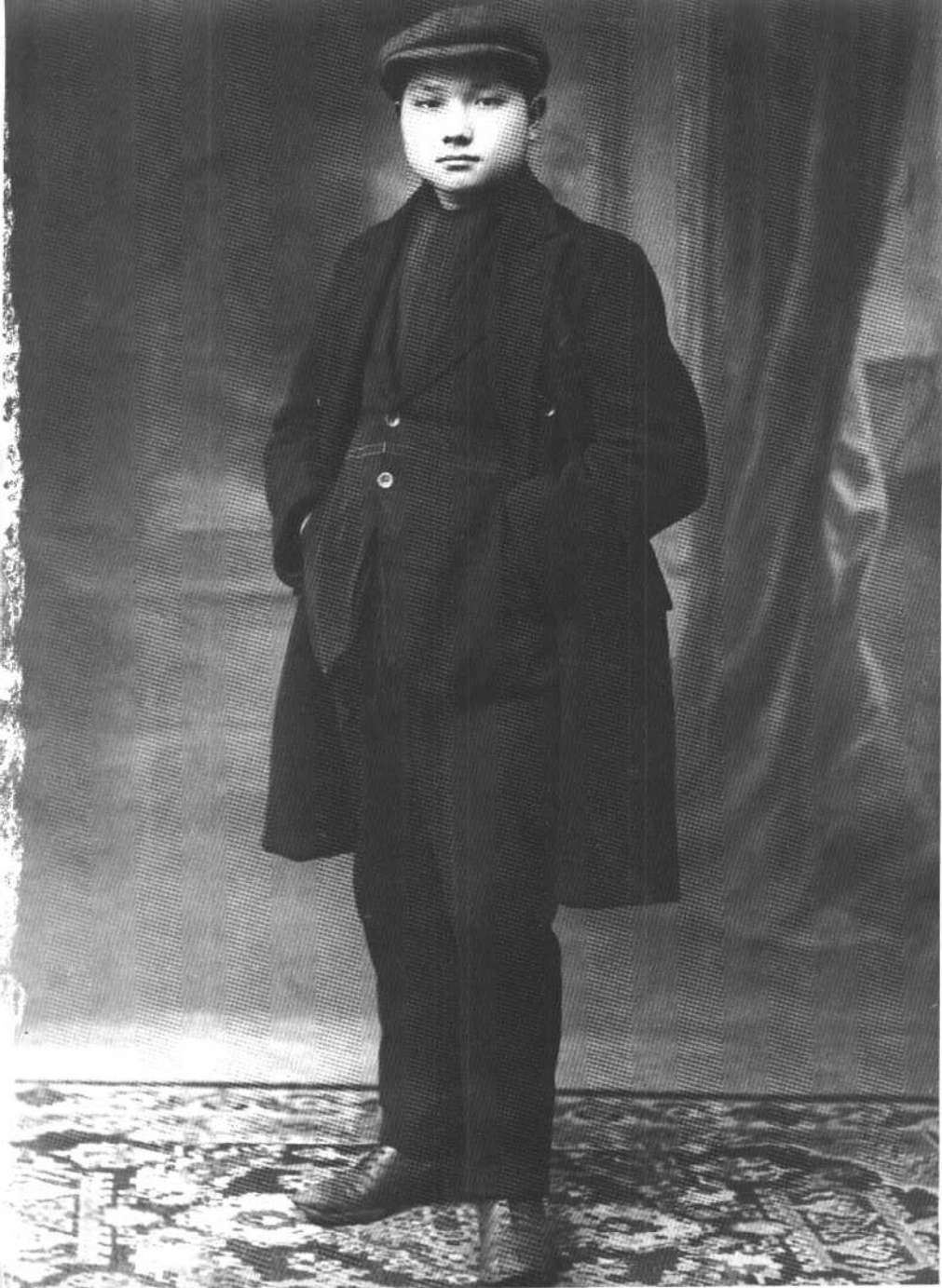
我父亲在留法勤工俭学时的留影。