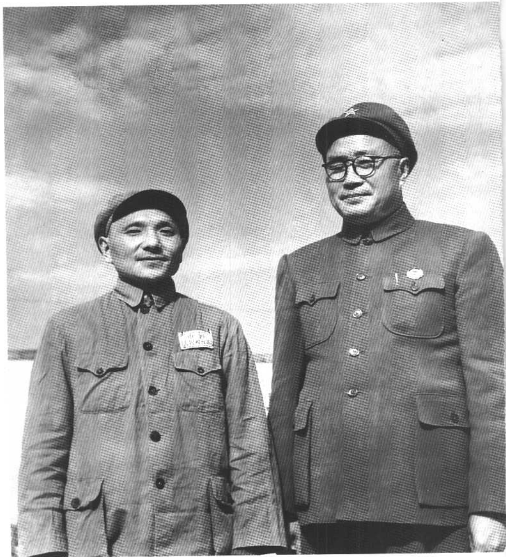
刘伯承伯伯和我父亲共事 13 年，他们领导的部队被称作“刘邓大军”。这是建国之初他们的合影。