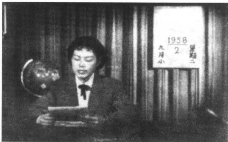
图2 1958年9月2日,前北京电视台正式播出