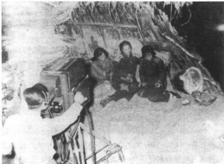
图4 前北京电视台试播第一部电视剧《一口菜饼子》