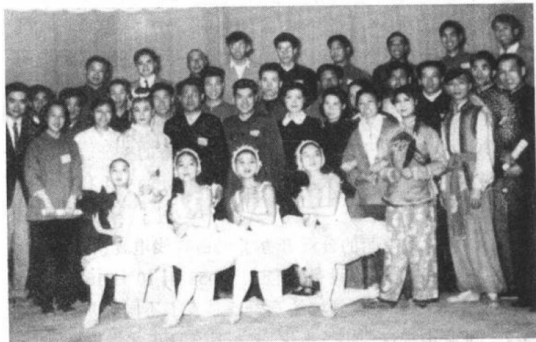
图1 1958年5月1日,前北京电视台首次试播后部分工作人员合影

1958年5月1日,中国第一座电视台开始试播,这就是中央电视台的前身,当时因为局限首都一地,被称为北京电视台(图1)。10月1日,中国第二座电视台——上海电视台问