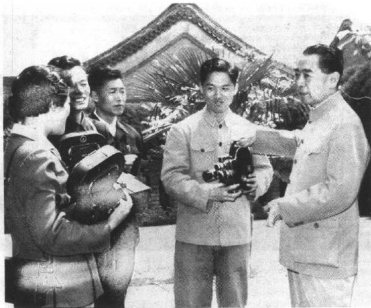
图3 周总理和电视台记者