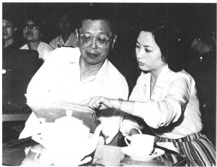
1979年6月，香港著名演员石慧来北京人艺观看《王昭君》的排练后，听曹禺介绍剧情。