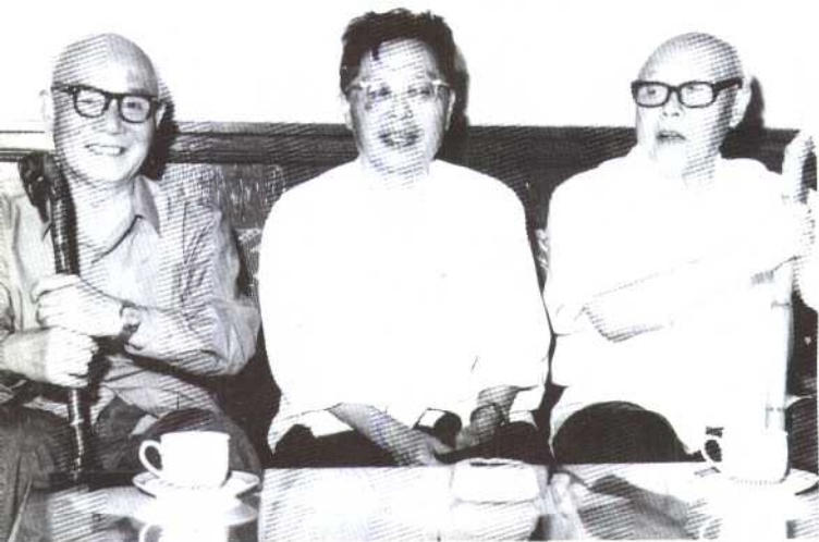
1979年8月，曹禺与李苦禅(右)、李可染(左)在一起。