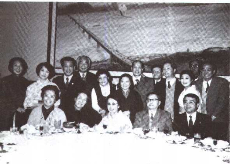
80年代，曹禺夫妇与日本友人杉村春子及国内文艺界知名人士聚会留影。