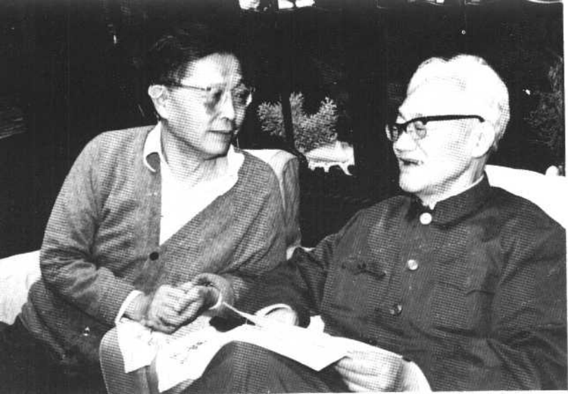
80年代，曹禺与巴金在上海亲切畅谈。