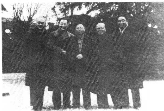
1957年，曹禺与黄 佐临、应云卫、吕复、熊 佛西等在上海合影。