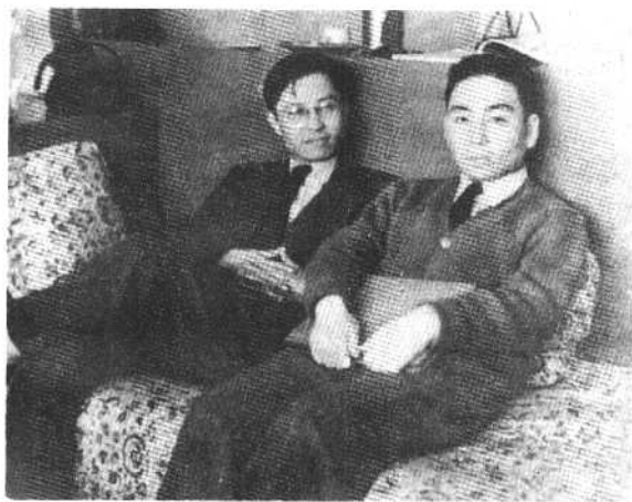
1948年，曹禺与吴祖光在九龙。