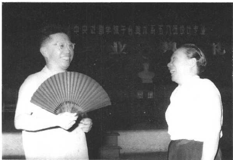
1962年，中央戏剧学院舞台美术系58班设计专业学生毕业典礼后，曹禺与李伯钊院长亲切交谈。