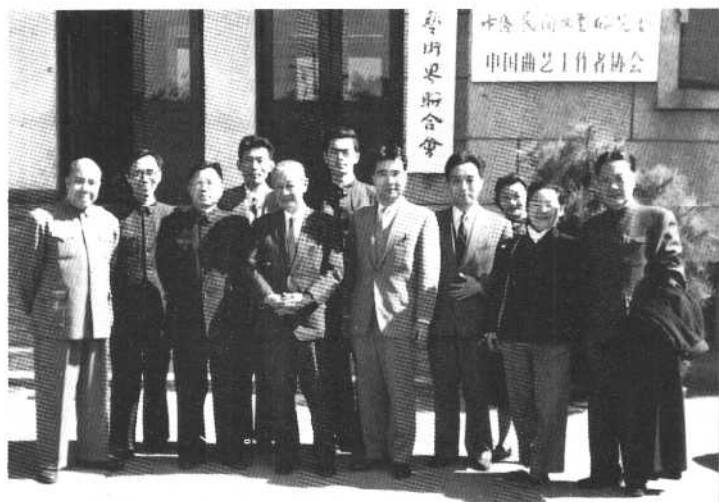
曹禺与日本朋友中岛健藏和白土吾夫及国内文艺界人士在中国文联机关大门前留影。