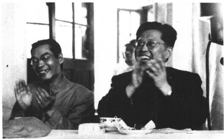
1954年6月，在北京人艺院庆会主席台上，曹禺与焦菊隐在一起。