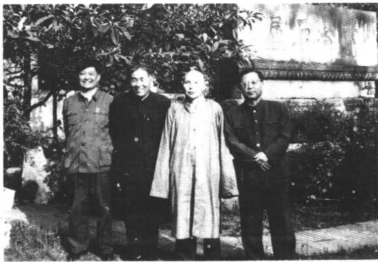
1981年，曹禺到扬州与端木蕻良等人合影。