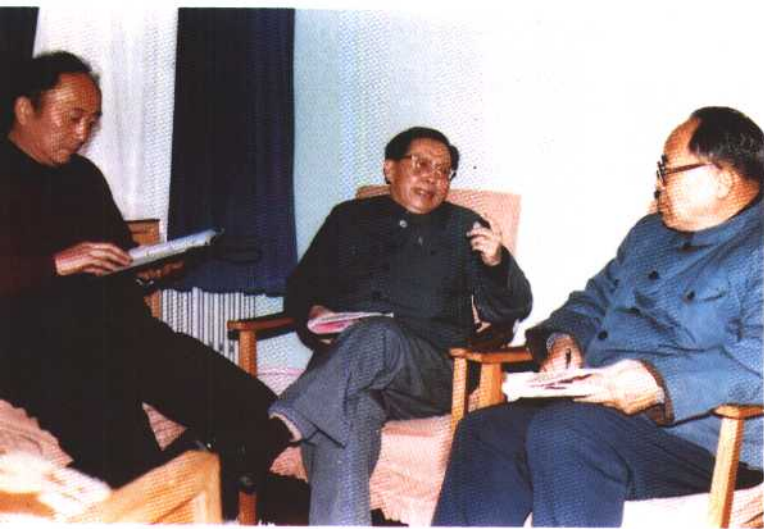
1983 年1月，曹禺与韩尚义、孙道临亲切交谈。