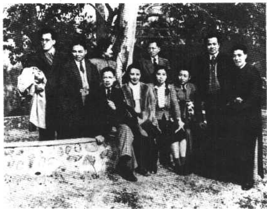
1949年2月，曹禺 与友人在香港浅水湾合影。左起：张骏祥、吴祖光、张瑞芳、夏衍、白杨、曹禺、沈宁、叶以群、周而复、阳翰笙。