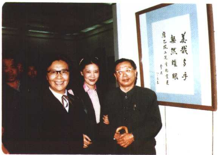
1981年，曹禹偕夫人参观香港画家 唐乙凤画展并欣然题赠。