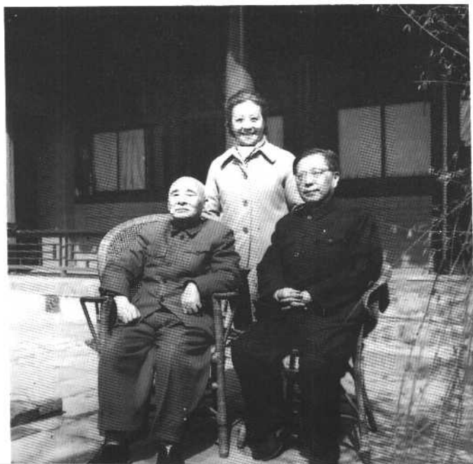
1980年，曹禺夫妇在叶圣陶家中与叶老留影。