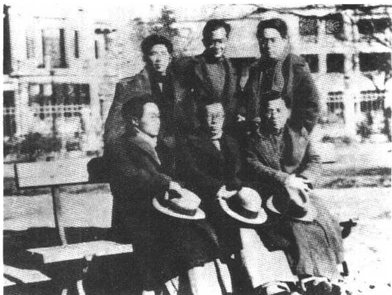
1935年，曹禺（前右）、靳以（后右）、萧乾（后中）等在天津留影。