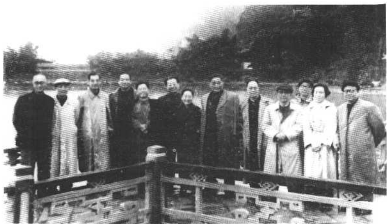
1961年冬，广州会议期间，曹禺与文艺界知名人士合影。左 三：焦菊隐，左五：曹禺，左七：凤子，右四：老舍。