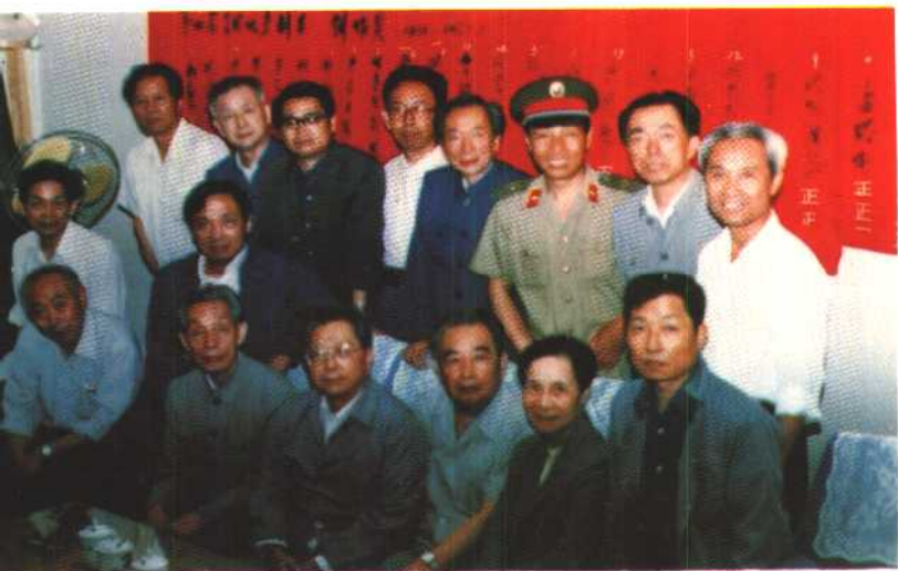
在剧本评选会上与评委们在一起。