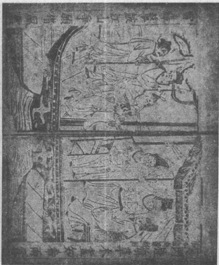
图二 第三十三回 宝船经过罗斛国