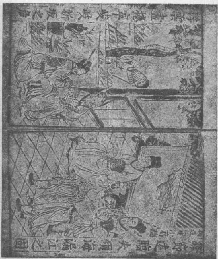
图三 第六十回 兵过柯枝小葛兰