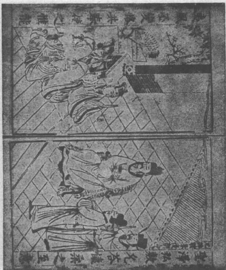
图四 第九十九回 元帅鞠躬复朝命