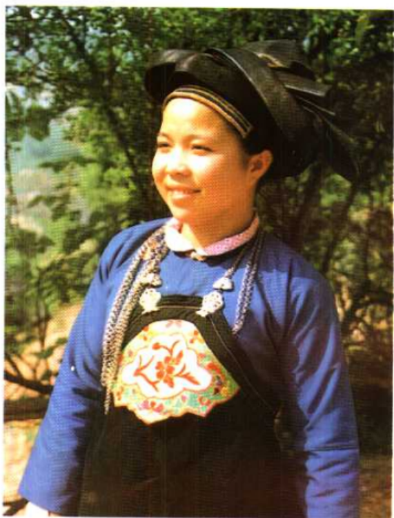
云南省文山壮族妇女