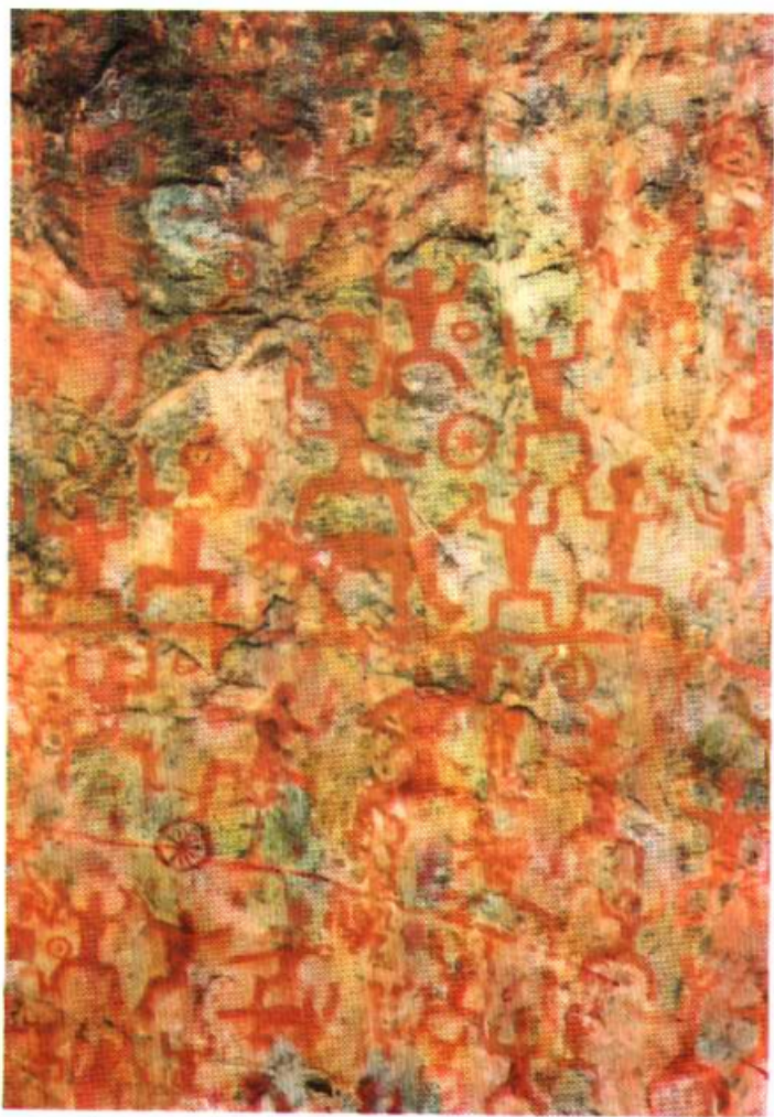
宁明县花山崖壁画