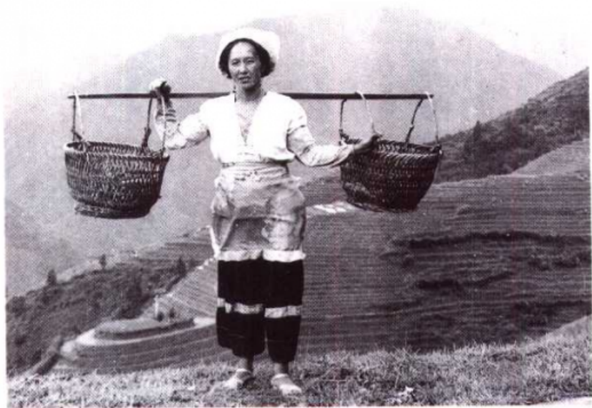
北方方言的壮族妇女