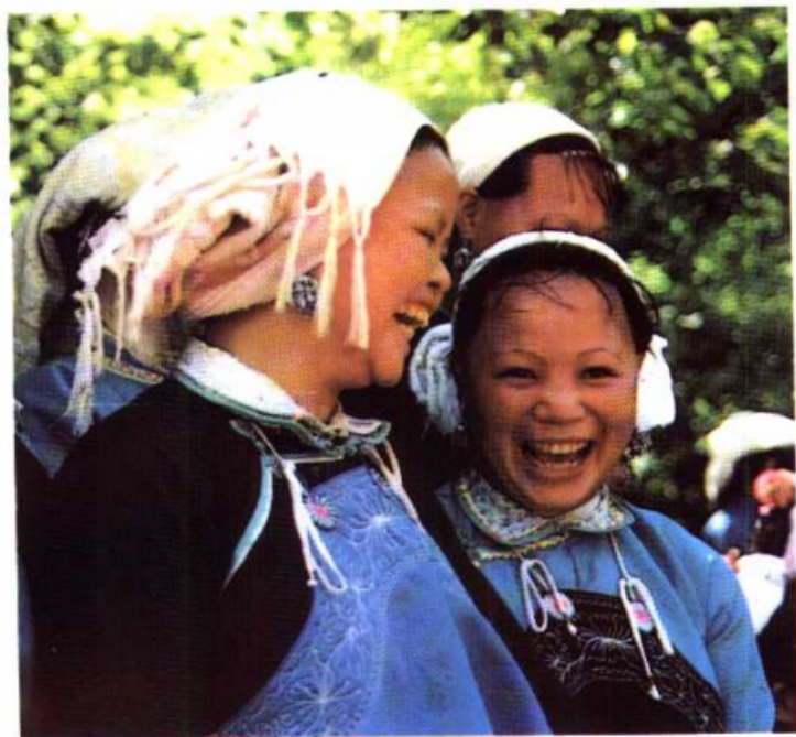
南方方言的壮族妇女