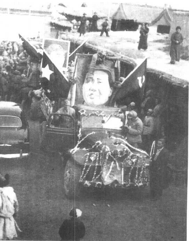
军民搭彩车，同庆西宁解放。