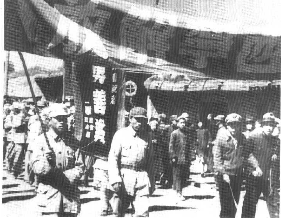
部队举着横幅走向庆祝西宁解放大会会场。