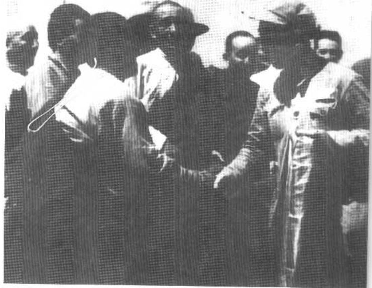
藏族同胞向王震司令员(右一)敬献哈达。