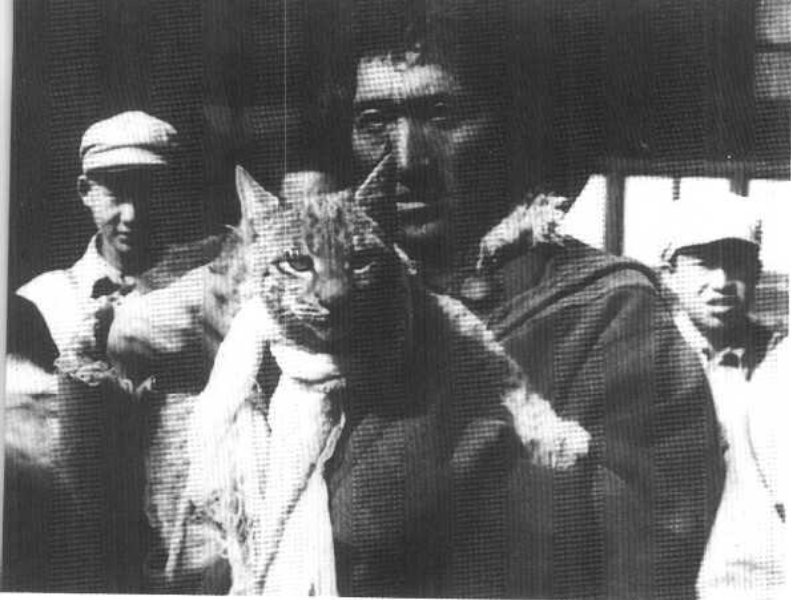
玉树、称多、昂欠三县藏族代表，携骏马千匹及金钱豹等珍贵礼品，到西宁慰问解放军。图为送的一只活猞猁。