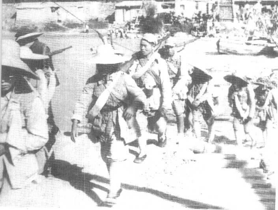
我军渡过洮河向临夏前进。