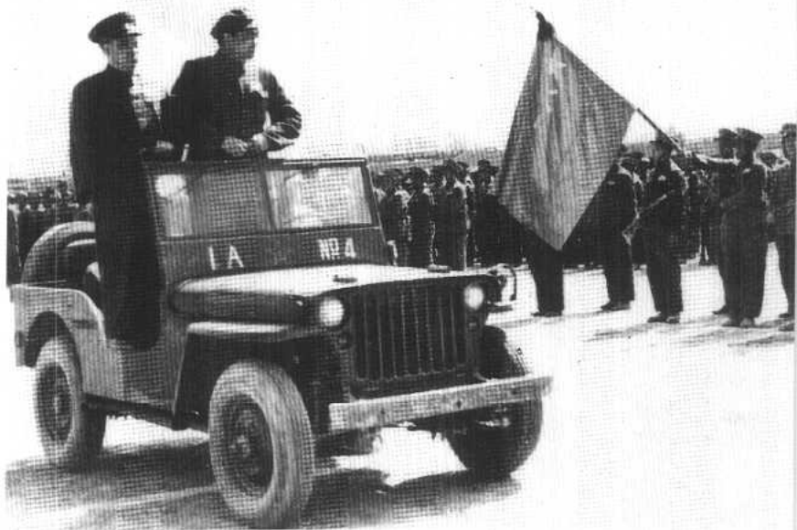
原第一野战军副司令员张宗逊(右)和一军军长贺炳炎(左)检阅部队。