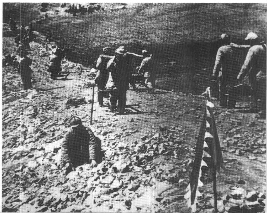
铺设宽阔平坦的路面