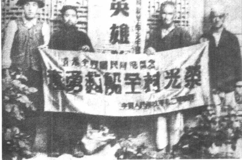
回族同胞奋不顾身抢救我军渡黄河中遇险的船只和部队。图为部队给回族同胞赠送的锦旗。