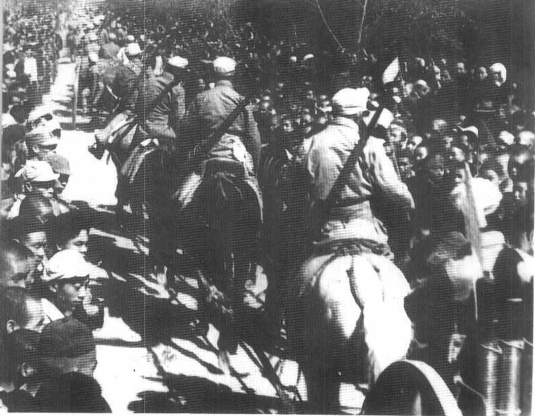
骑兵进入庆祝西宁解放大会会场。