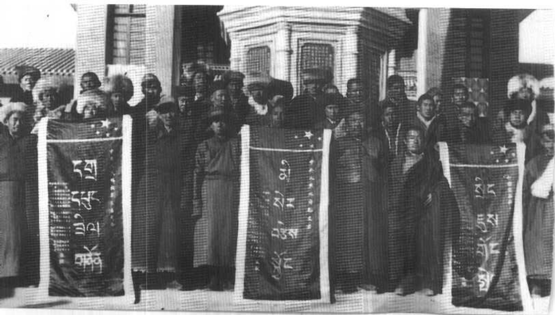
塔尔寺僧众向省人民军政委员会献旗致敬。