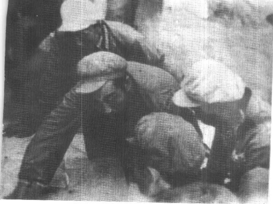
一兵团司令员兼政委王震（右三）作西进的部署。