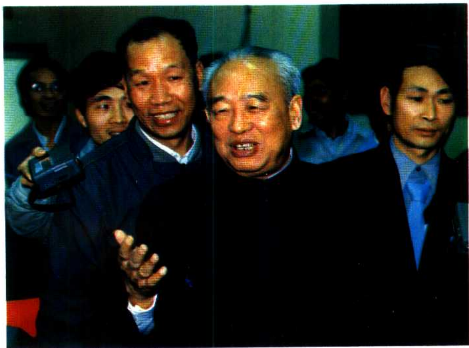
7 余秋里同志与炼油厂技术人员交谈