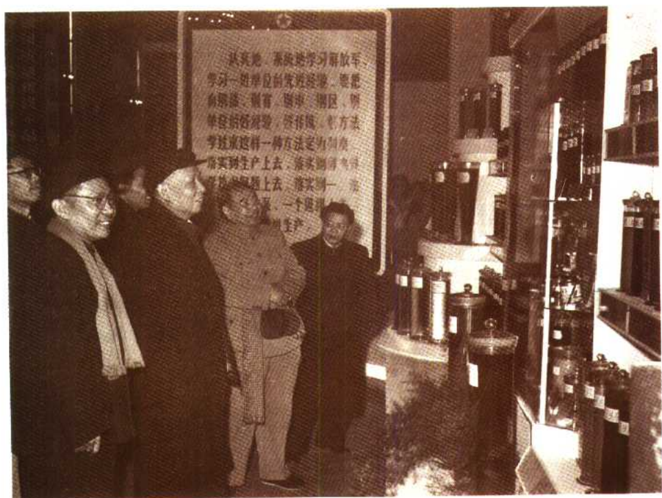
2 刘少奇同志视察炼油厂参观石油产品台