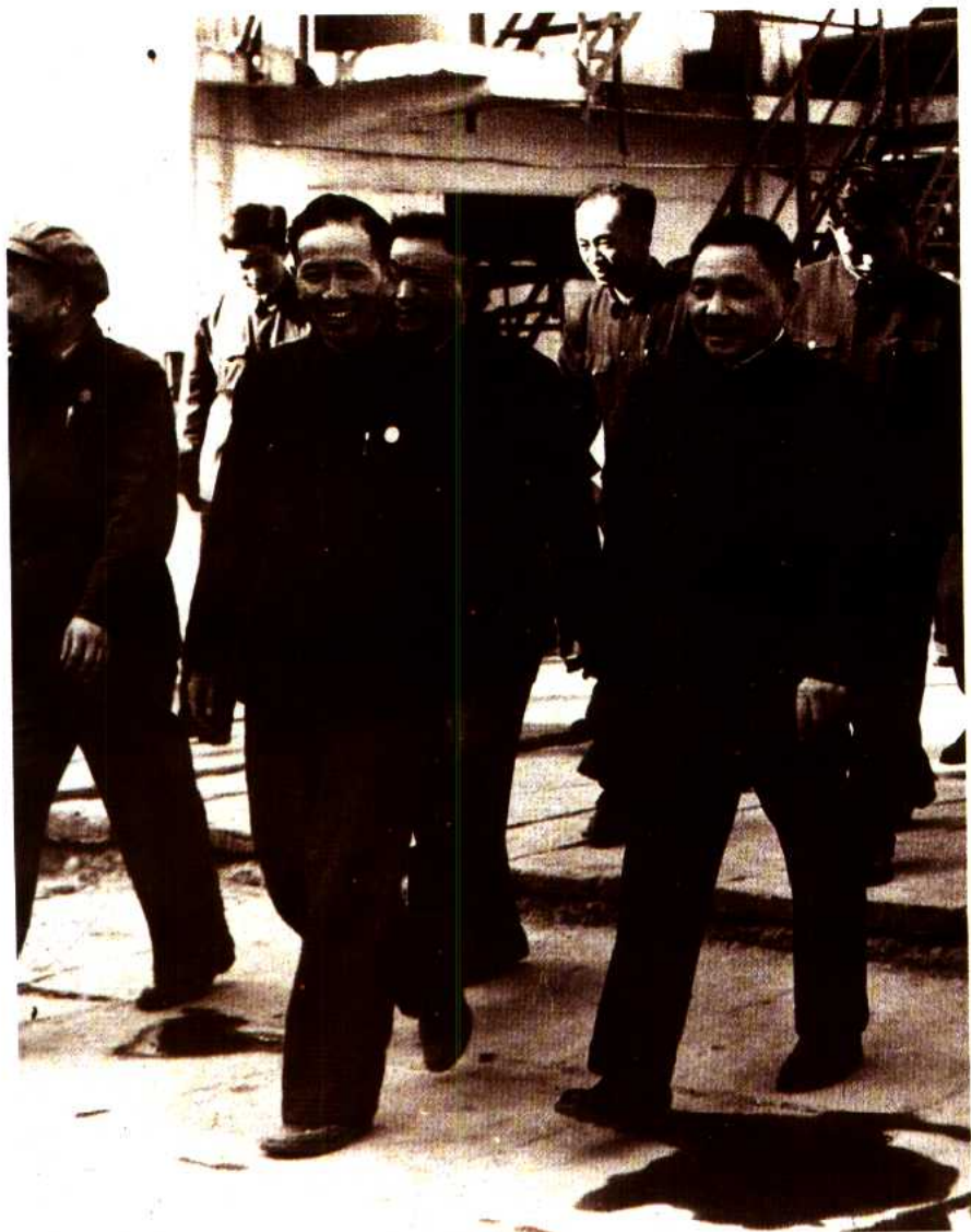
5 邓小平同志视察炼油厂