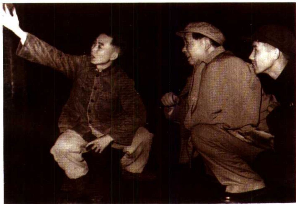
1 毛泽东主席视察隆昌气矿