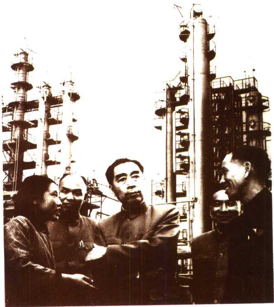
3 周恩来总理视察炼油厂