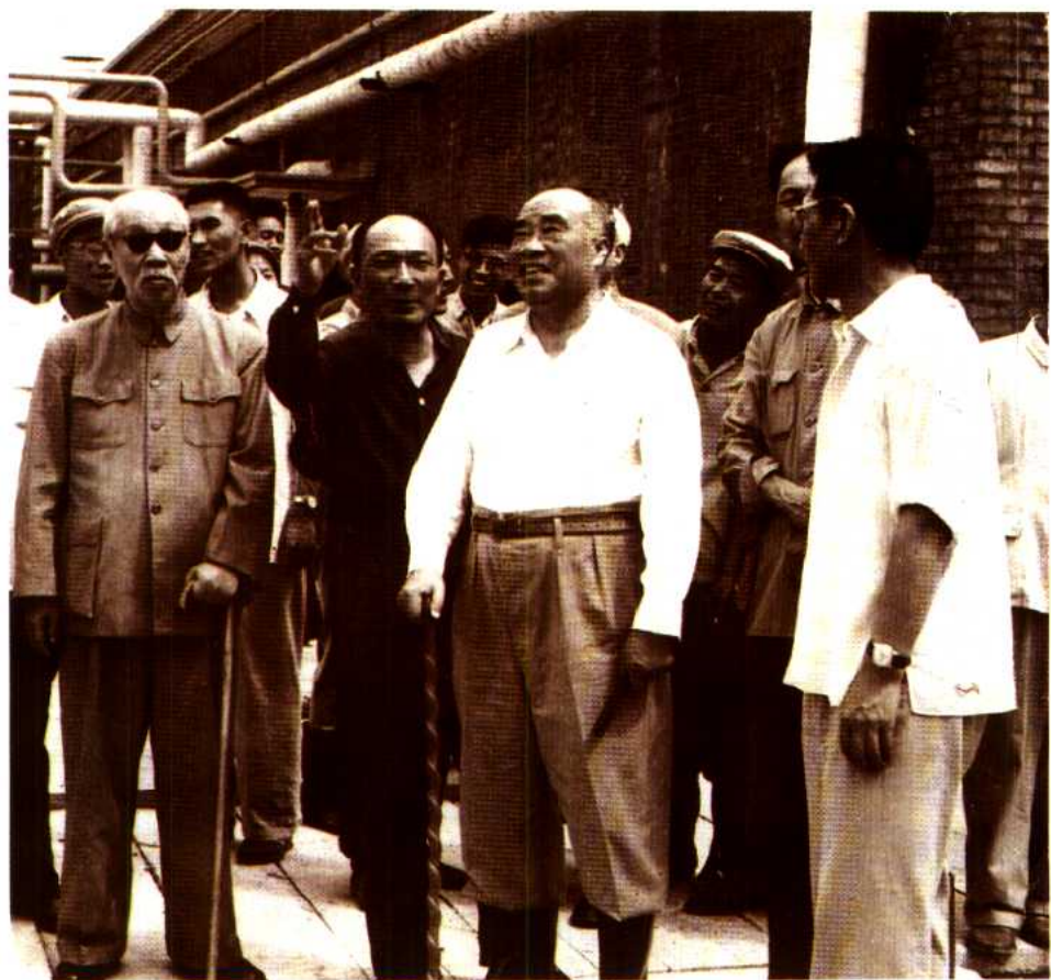
4 朱德、董必武同志视察炼油厂