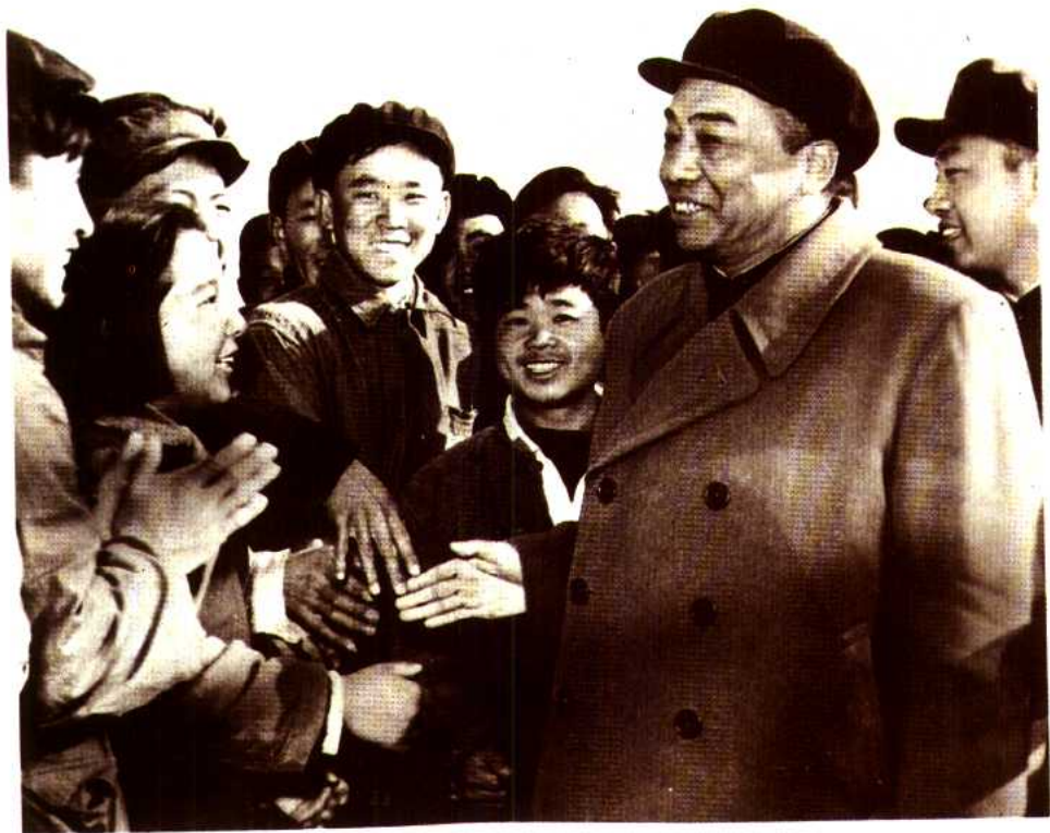
6 彭德怀同志和炼油工人在一起