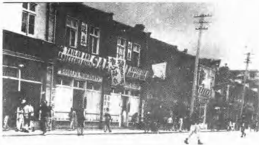
1919年8月上海南京路商店罢市