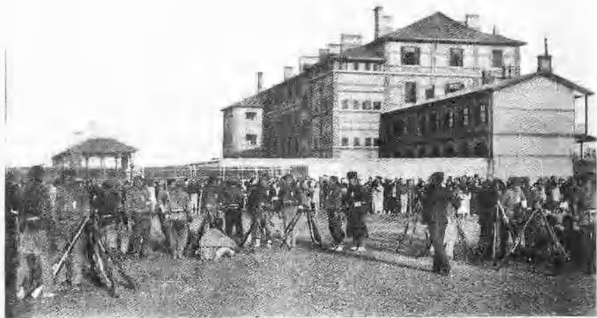
上海光复后民军在闸北操练