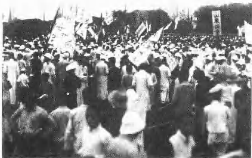
1919年5月7日上海各界在南市公共体育场举行国民大会