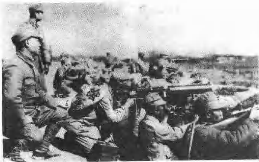
“一二八”抗战时中国军队的阵地