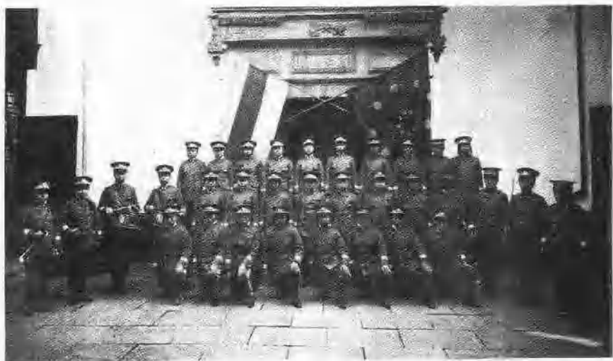
辛亥革命时期的上海女国民军