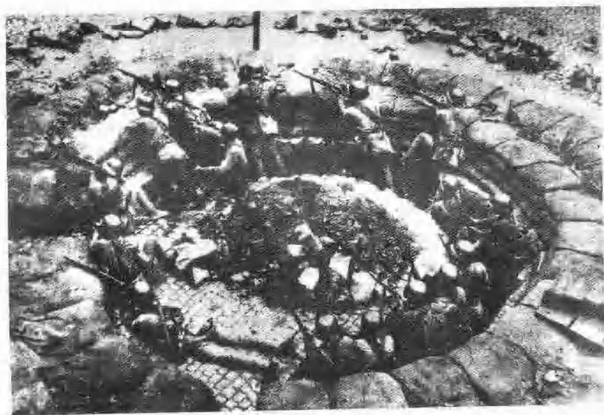
“八一三”抗战中浴血奋战的中国军队