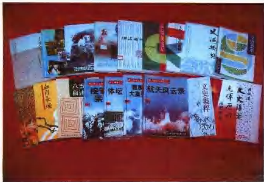
近年编印的部分专题文史资料