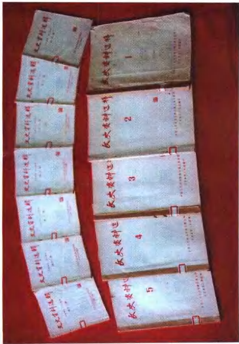
早期的《文史资料选辑》