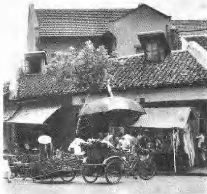
沪西工友俱乐部 旧址