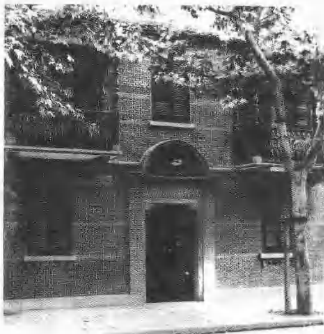
党的一大代表住 宿地博文女校