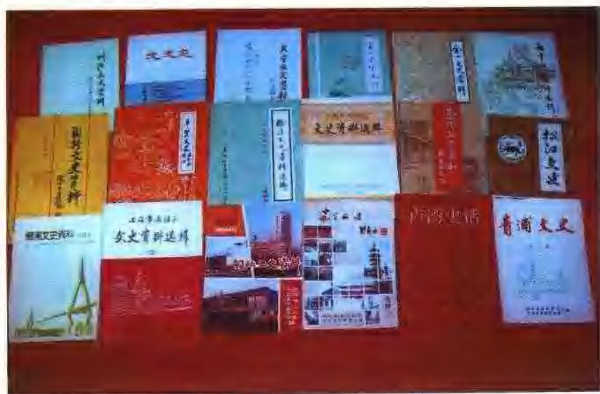
区、县政协编印的部分文史资料