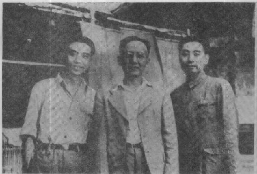
右起：周恩来、郭沫若、阳翰笙（摄于四十年代）