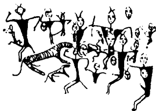
新疆呼图壁岩画：《生殖崇拜图》

很集中。这组岩画凿刻在将军崖南口一弧形巨石上，共 10 个人面形，人面下与植物相连，好像植物结出来的果实，制作手法是用坚硬石器磨刻的，阴线粗深圆滑，刻痕断面呈 U 形，深约 1 厘米，宽度在 2、3 厘米之间。10 个人面形大小不等，最大的人面高 90 厘米，作老妪模样；最小的仅高 18 厘米。小人面围绕大人面周围，好像是一个大家族的孩子子孙孙围着一位老祖母。植物纹表示农作物