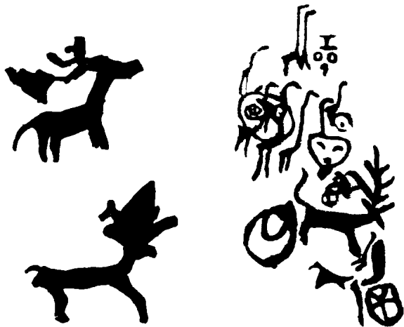
内蒙古阴山岩画：《鸵鸟和大角鹿》

为站立抬头远望的姿势，特征也比较明显。对这几组岩画的含义，目前尚难确定，或许是一种动物崇拜的形式。在凿刻系统岩画中，寓意明确，形象组合严密的，当属新疆呼图壁“生殖崇拜”岩画群和江苏连云港将军崖“稷神崇拜图”岩画群。