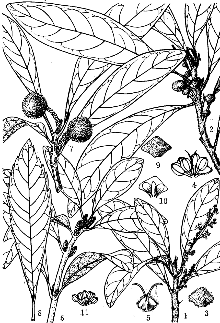
1-5. 毛杨梅 Myrica esculenta Buch.-Ham. 1.雄花枝; 2.果枝; 3.雄花苞片外侧; 4.雄蕊; 5.雌蕊。 6-11. 杨梅 Myrica rubra (Lour.) Sieb. et Zucc. 6.雄花枝; 7.果枝; 8.幼树及萌生枝上叶; 9.雄花苞片外侧; 10.雄花小苞片; 11.雄蕊。(杨再新绘)