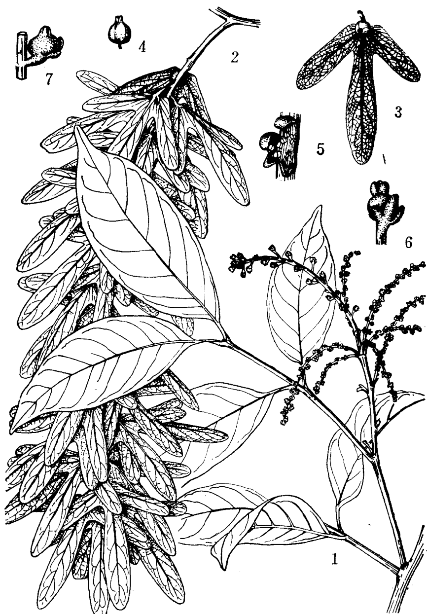
黄杞 Engelhardia roxburghiana Wall. 1.雌、雄花枝；2.果枝；3.果及苞片；4.果；5.雄花；6.雌花正面；7.雌花侧面。（陈 笈绘）