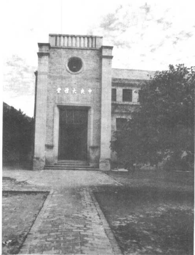
延安中共中央大礼堂