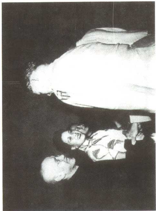
蒋先生与洋人的接洽，多仗其夫人宋美龄女士