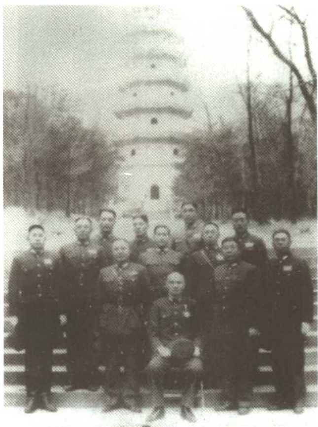
蒋介石与其高级官佐合影,其中多为“黄埔”学生