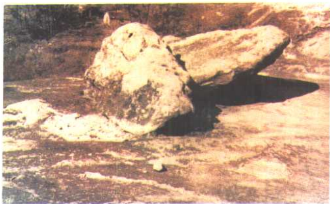
将军崖东夷社祀遗址中心大石