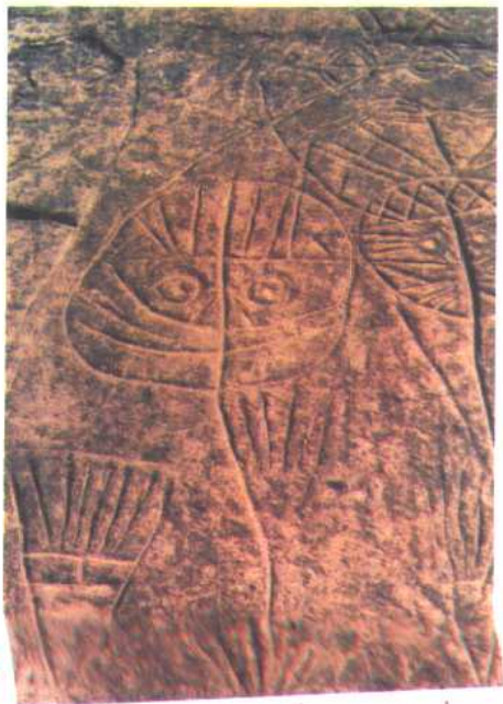
将军崖东夷社祀遗迹