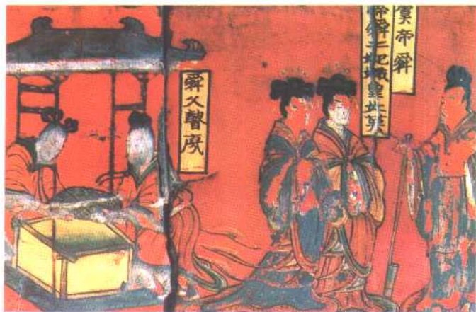
帝舜二妃娥皇女英