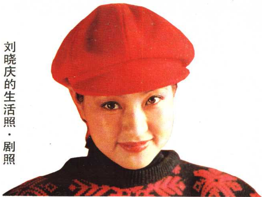
刘晓庆的生活照·剧照