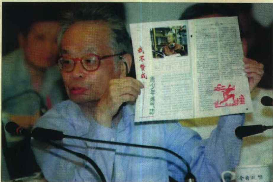
中国科学院院士、中国著名物理学家何祚麻揭露“法轮功”。