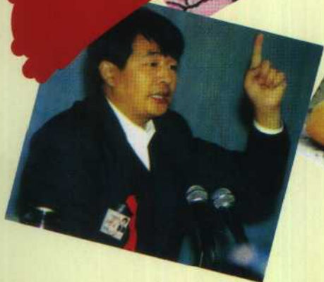
李洪志满嘴胡说，大放歪理。