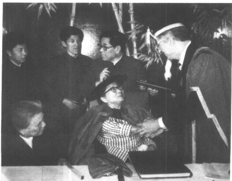
1981年5月8日，宋庆龄接受加拿大维多利亚大学授予的荣誉法学博士学位。