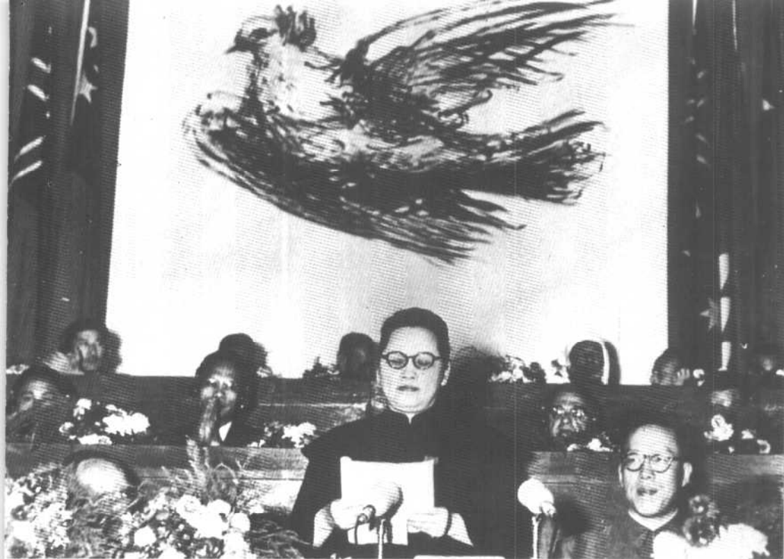
1952年10月2日，亚洲及太平洋区域和平会议在北京召开，宋庆龄作为中国代表团团长、大会主席团主席致开幕词。