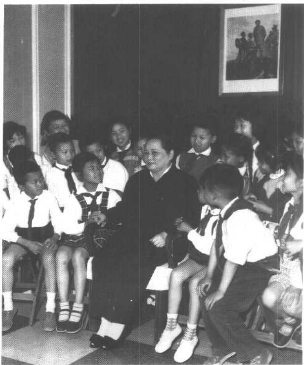
1965年5月，宋庆龄在上海中国福利会少年宫同儿童在一起。