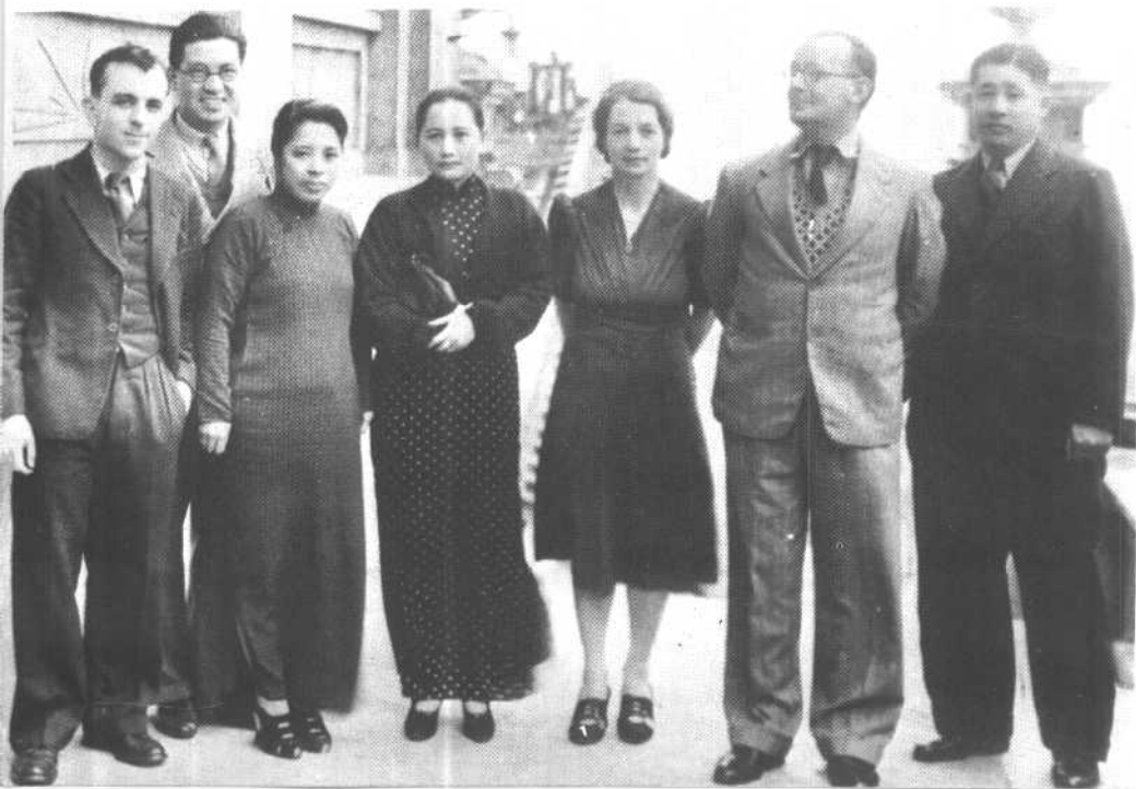
1938年，宋庆龄和保卫中国同盟中央委员会委员合影于香港。自右至左： 廖承志、法朗斯、克拉克、宋庆龄、 廖梦醒、邓文钊、爱泼斯坦。