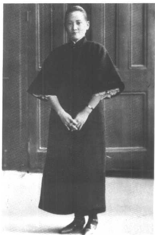
1927年，宋庆龄在武汉任国民政府委员和国民党中央政治委员会委员时留影。她忠贞不渝地执行孙中山的新三民主义和三大政策，推动北伐战争。