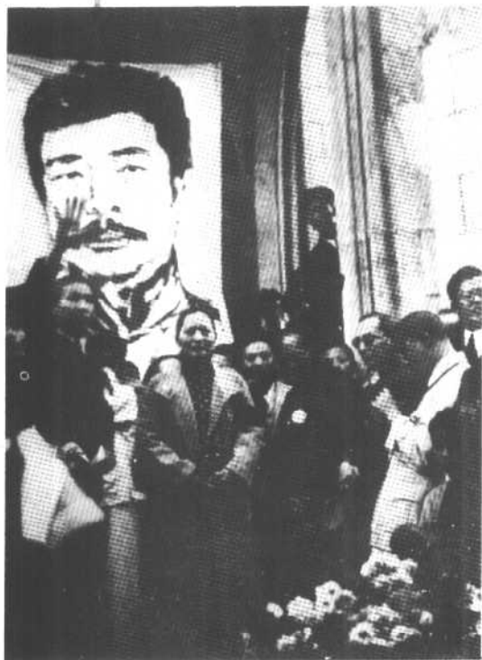
1936年10月22日，宋庆龄在鲁迅的追悼会上。