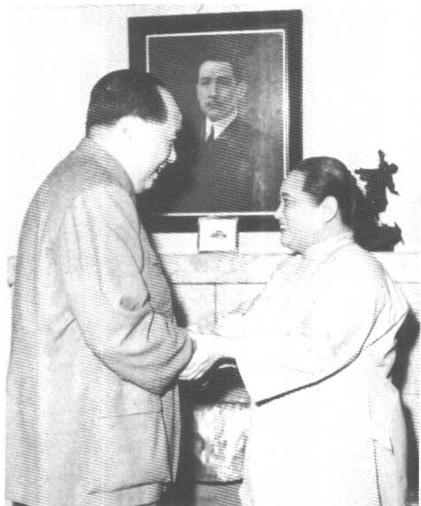
1964年2月，宋庆龄同周恩来、陈毅对斯里兰卡进行国事访问时受到热烈欢迎。