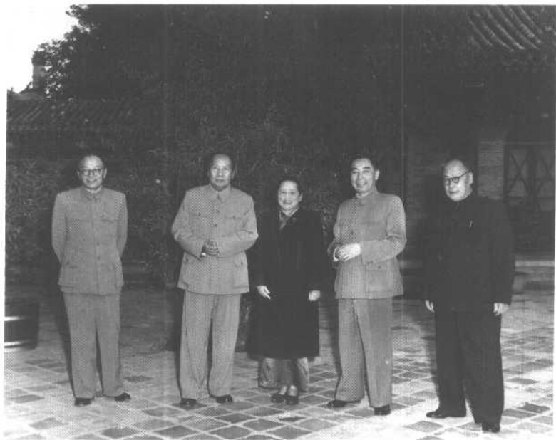
1956年10月，宋庆龄和毛泽东、周恩来、陈毅、张闻天在北京中南海。

1959年4月27日，宋庆龄在中华人民共和国第二届全国人民代表大会第一次会议主席台上。在这次会议上，她当选为中华人民共和国副主席。