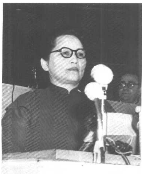
1952年12月，宋庆龄率领中国代表团出席在维也纳举行的世界人民和平大会。这是她在大会上发言。