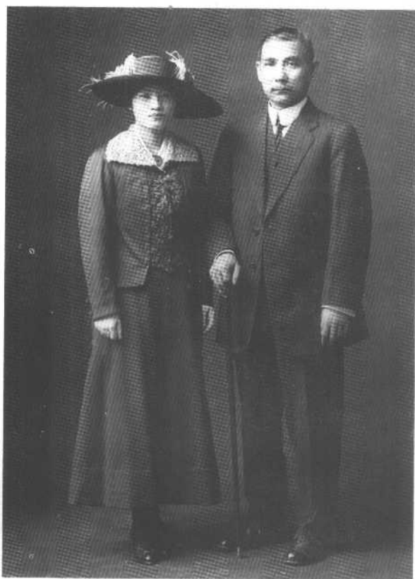
1915年10月25日，宋庆龄与孙中山在日本东京结婚，这是婚后留影。