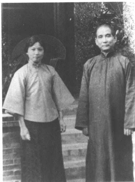
1922年，孙中山、宋庆龄在上海住所前留影。