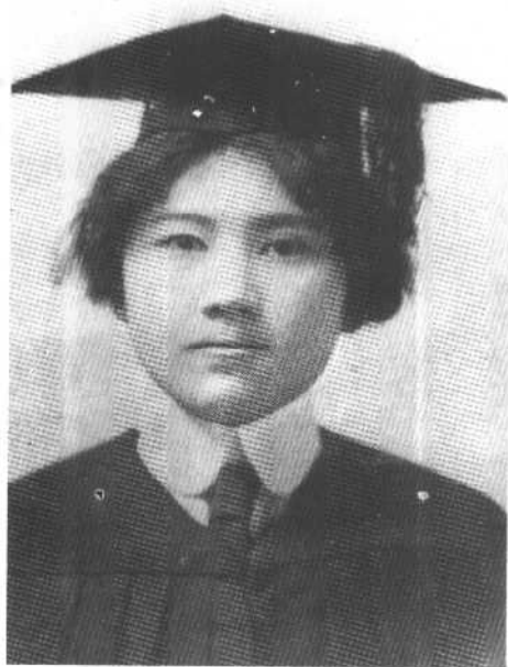
1913年宋庆龄在美国佐治亚州梅肯市威斯里安女子学院获文学学士学位的大学毕业照。