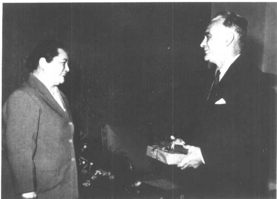
1964年12月18日，宋庆龄在北京住所会见中国人民的老朋友、美国著名作家埃德加·斯诺。