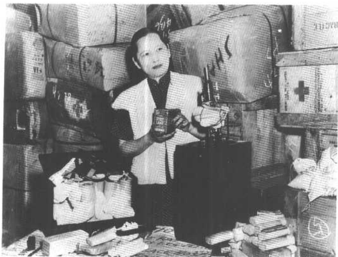
1948年，宋庆龄在检查运往解放区的医药器材。

1949年9月21日至30日，宋庆龄出席中国人民政治协商会议第一届全体会议并发表讲话。在这次会议上，她当选为中华人民共和国中央人民政府副主席。