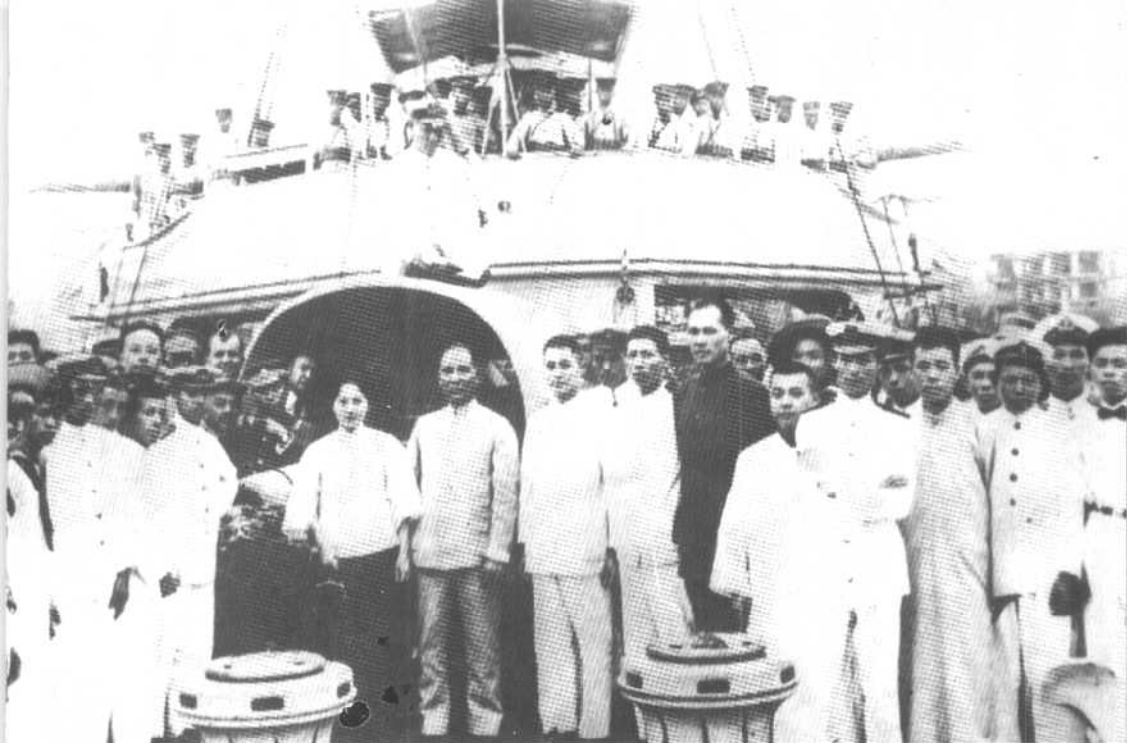
1923年8月，孙中山、宋庆龄在永丰舰与官兵合影，纪念蒙难一周年。