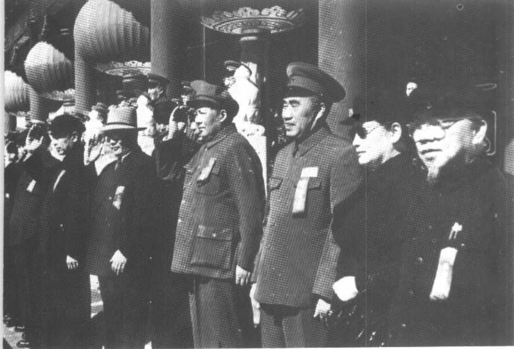
1951年国庆节，宋庆龄在天安门城楼上。（右二）