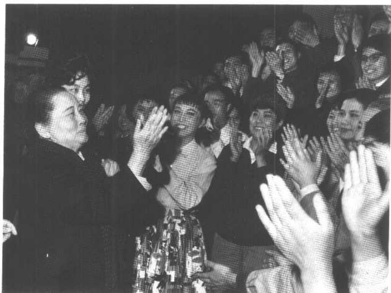
1979年3月，宋庆龄观看中国福利会儿童艺术剧院创作演出的话剧《童心》后，向演员们祝贺演出成功。