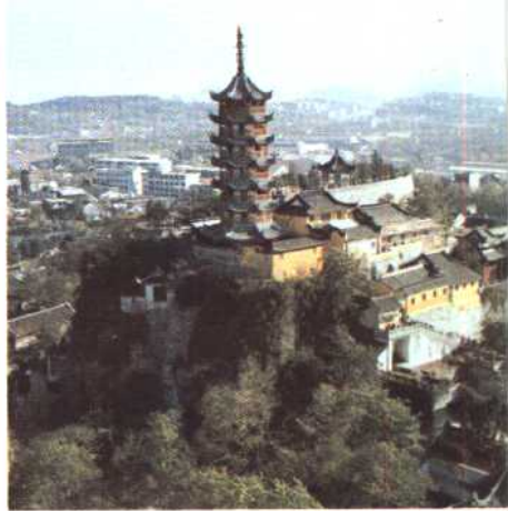
下 里下河之春 中 苏北运河 上右 镇江金山 上左 扬州瘦西湖