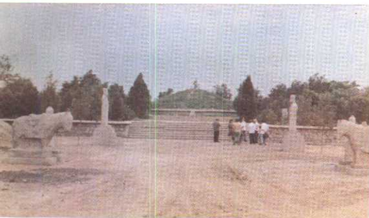
下 北运河上的水闸 中 德州苏禄王墓 上右 天津食品街 上左 干枯的南运河