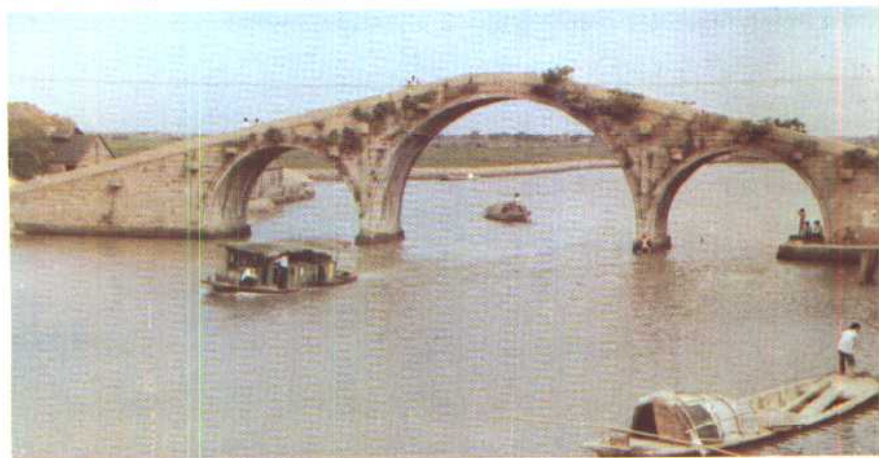
上 杭嘉湖平原上的江南运河 中 江浙交界处的汪江泾大桥 下 同里退思园