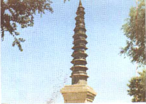
上左 孔府故井 上右 临清铁塔 中 曲阜孔庙大成殿 下左 武松打虎处 遗址 下右 聊城山陕会馆