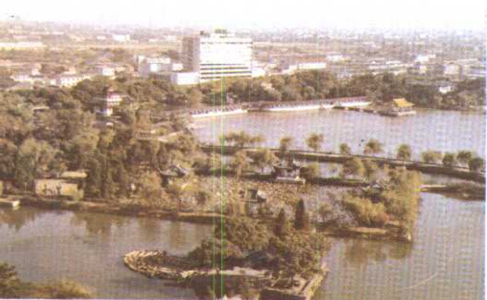
下 常州红梅公园 中 无锡太湖之滨 上右 苏州虎丘 上左 太湖帆影