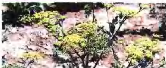
杭白芷 (伞形科) Angelica dahurica (Fisch. ex Hoffm.) 主产于浙江, 福建, 河北等省, 现多栽培。药用部位为根, 夏秋间叶黄时采收。