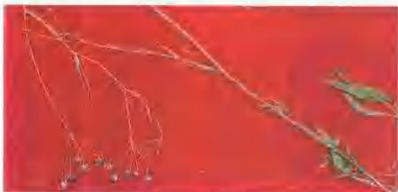
竹叶防风(伞形科) Seseli delavayi Franch. 的根在西南地区也作防风入药,叫云防风,是防风混乱品种