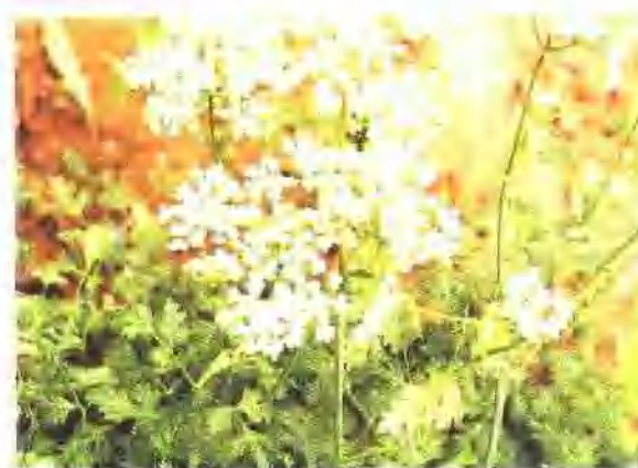
辽藁本(伞形科) Ligusticum jeholense Nakai et Kitag. 主产辽宁、河北。野生林缘和林下。药用根及根茎。早春或秋末采收。