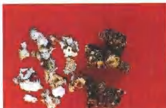
藁本药材 不规则结节状圆柱形, 有分枝, 表面棕褐色或暗棕色, 粗糙, 有纵皱纹, 上侧残留数个凹陷的圆形茎基。体轻, 质硬, 易折断。气浓香, 味辛苦, 微麻。