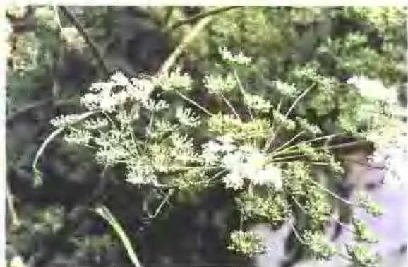
羌活(伞形科) Notopterygium incisum Ting ex H. F. Chang. 主产青海、四川、甘肃。生长高山向阳山坡草丛及灌丛中。药用根及根茎。春秋采收。尚有宽叶羌活的根及根茎入药。