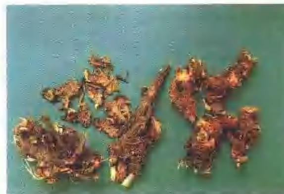
辽藁本、辽藁本片 较小, 呈不规则团块或柱状, 有多数细长弯曲的根。