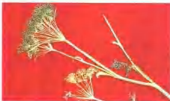
川防风(伞形科) Ligusticum sinense Franch. 的根在西南地区作防风入药,是防风的混乱品种