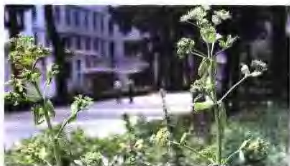
白芷 (伞形科) Angelica dahurica (Fisch. ex Hoffm.) Benth. et Hook. f. var. formosana (Boiss.) Shan et Yuan. 主产于东北地区及山东, 河北等省。多生于河岸, 溪边, 现多栽培。