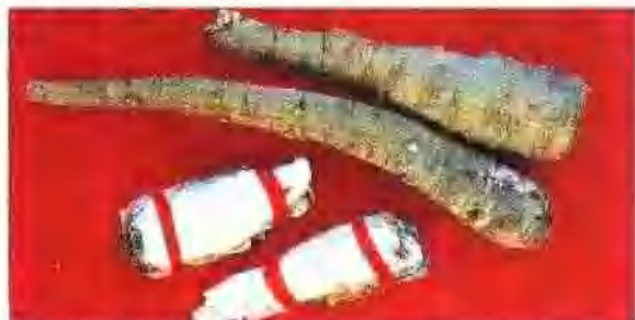
杭白芷片 椭圆形及圆形切片, 形成层环, 木质部略呈方形, 木质部约占断面的 1/2。

白芷药材 长圆锥形, 表面灰黄色至黄棕色, 有多数纵皱纹及支根痕, 有皮孔样的横向突起。顶端有凹陷的茎痕。质硬, 断面灰白色, 粉性。气芳香, 味辛, 微苦。 白芷片 圆形横切片或纵切片, 厚 2~3mm。切面类白色或灰白色, 形成层环纹棕色, 明显。圆形, 木质部约占断面的 1/3, 具放射状纹理, 皮部有多数棕色油点, 周边灰棕或黄棕色。