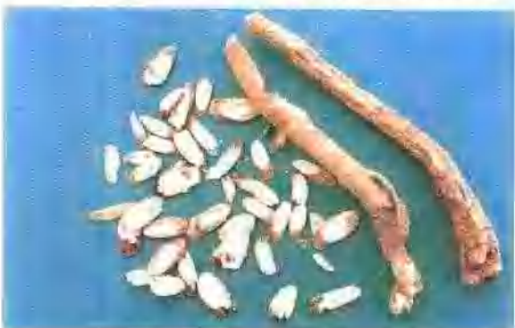
川防风 长10~15cm,表面棕黄或浅褐色,有侧根或根痕,有的纵皱明显,顶端1至数个茎基,无纤维状物,质坚实,断面淡黄白色,皮部约占三分之一强,形成层环明显,棕色,味甘,气微。