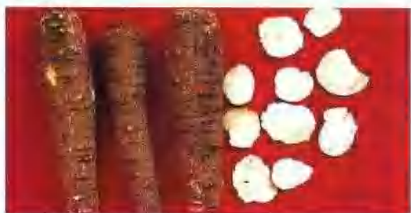
杭白芷药材 与白芷近似, 主要不同点为横向皮孔样突起成四纵列排列, 根具四纵棱, 即方头圆身。