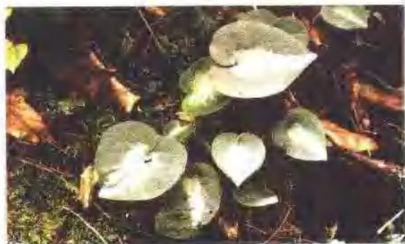
杜衡(马兜铃科) Asarum forbesii Maxim. 主产华东, 生林间下较潮湿处。全草称土细辛, 是细辛的混乱品种。