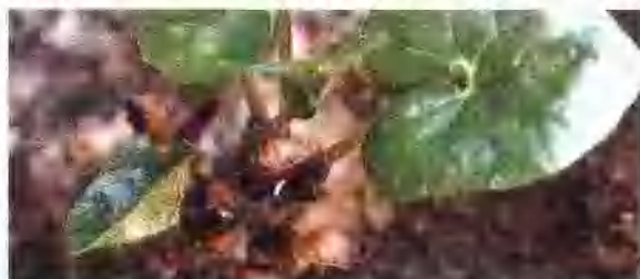
华细辛 (马兜铃科) Asarum sieboldii Miq. 主产陕西, 河南, 山东。分布于山谷溪边, 林下, 岩石旁等阴湿处。以带根全草入药。6~7 月间采收。