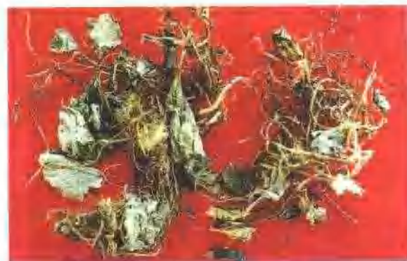
杜衡(土细辛)药材 根茎为不规则圆柱形, 微棕至淡黄棕色, 下部生多数须根, 根细圆柱形, 长约7cm, 直径1~2mm, 表面灰白至淡棕色, 具细纵皱。质脆, 断面类白色, 叶基生, 柄长, 叶片宽心形至肾形, 先端圆钝, 形似马蹄。干品叶缘卷缩, 质硬而脆。气芳香, 叶辛辣。