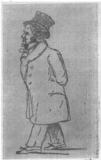
贝多芬的速写像 (吕泽尔画)

在维也纳，贝多芬始终保持了自己的做人的尊严，从不允许王公贵族轻视自己。比如1804年的一天，他被邀去会见普鲁士王子路易