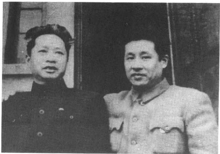
叶挺、廖承志（左至右）出狱后在重庆中山路中共代表团驻地（一九四六年三月）