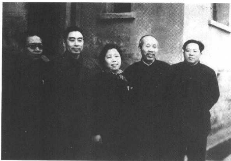
中共代表在重庆中山路代表团驻地(一)。左至右：陆定一、周恩来、邓颖超、董必武、王若飞