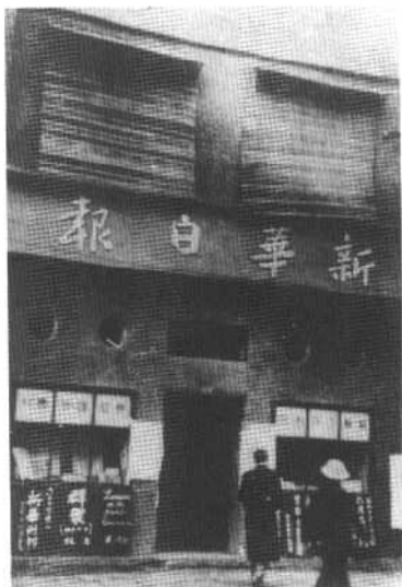
重庆《新华日报》营业部