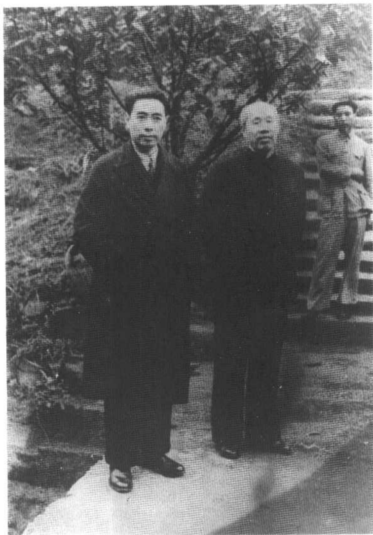
周恩来、董必武（左至右）在重庆红岩八路军办事处 （一九四〇年）