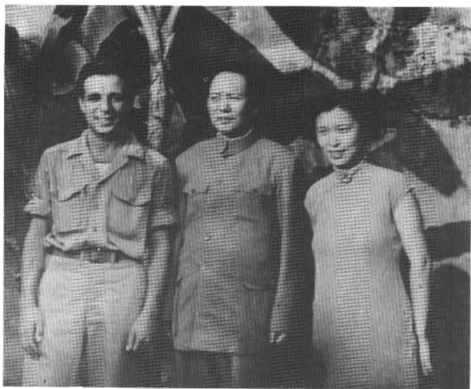
毛泽东和美国空军士兵埃德尔曼·杰克在 重庆红岩八路军办事处。右为外事组工作 人员龚澎（一九四五年九月）