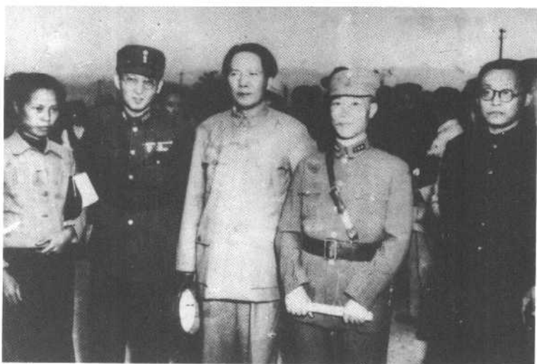
毛泽东由张治中（左二）陪同从重庆返延安。蒋介石派 代表陈诚（右二）到机场送行。右一为陶行知，左一为 于立群（一九四五年十月十一日）