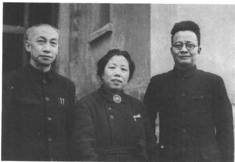
中共代表在重庆中山路代表团驻地(二)。左至右：吴玉章、邓颖超、秦邦宪