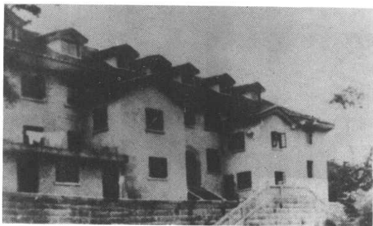
重庆红岩八路军办事处办公楼（中共中央南方局在二、三层办公）