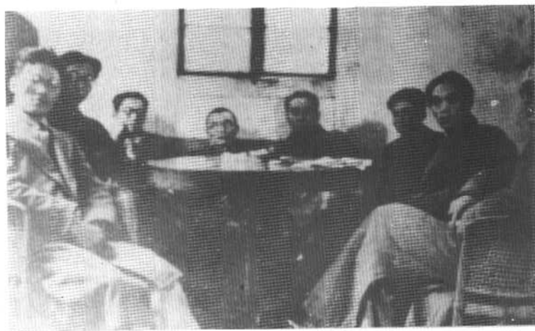
周恩来在重庆《新华日报》编辑部。左至右：许涤新、戈宝权、华西园、潘梓年、周恩来、陈家康、薛子正、胡绳