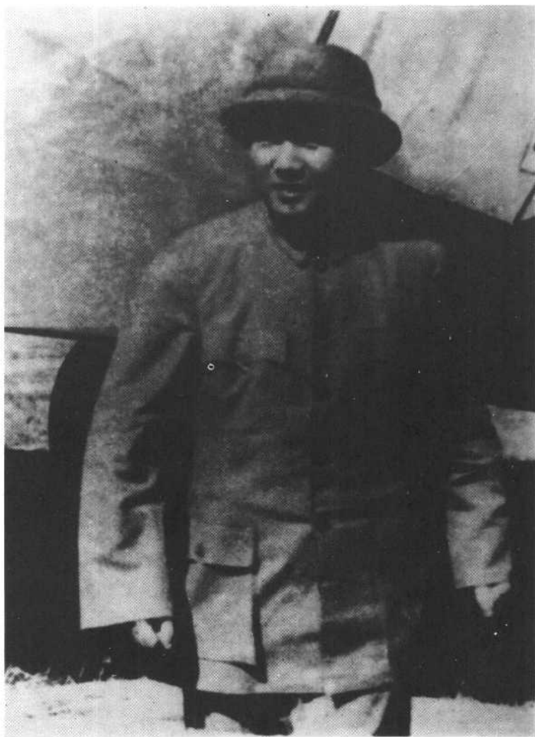
毛泽东在重庆机场(一九四五年八月二十八日)