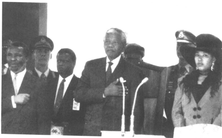
● 就任总统。从右至左：女儿泽娜妮、曼德拉、姆贝基