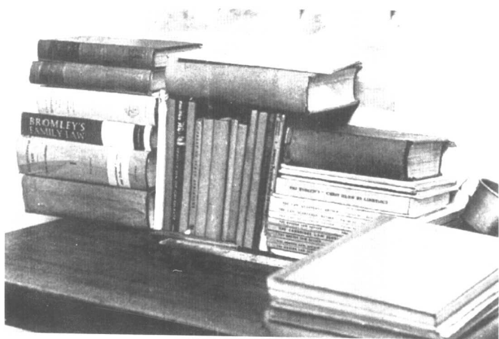
● 在罗本岛监狱中读过的书