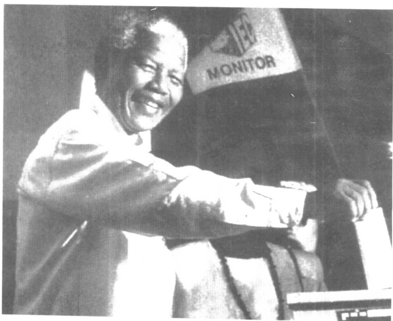
● 曼德拉在大选中投票