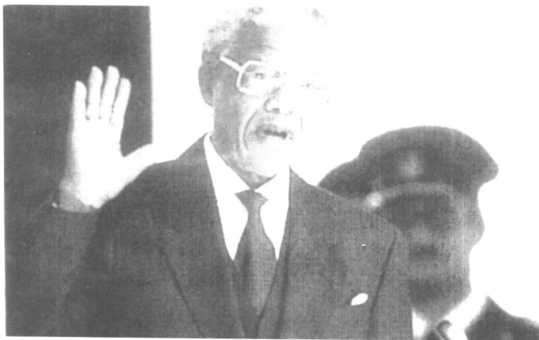
● 曼德拉在法庭外与支持者引吭高歌