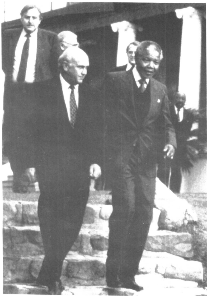
● 黑白两舵手——曼德拉与德克勒克