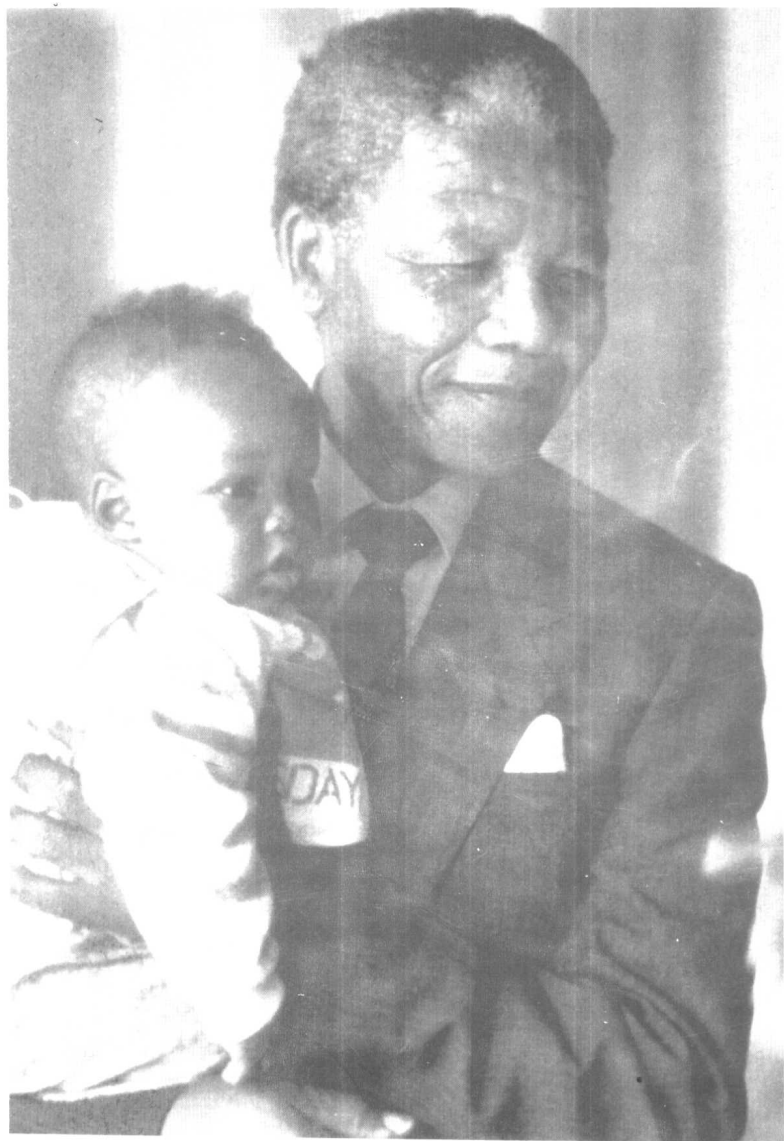
● 曼德拉与孙子班巴塔