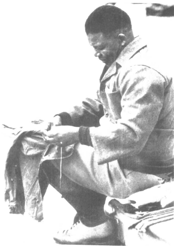
● 在罗本岛监狱缝补邮袋