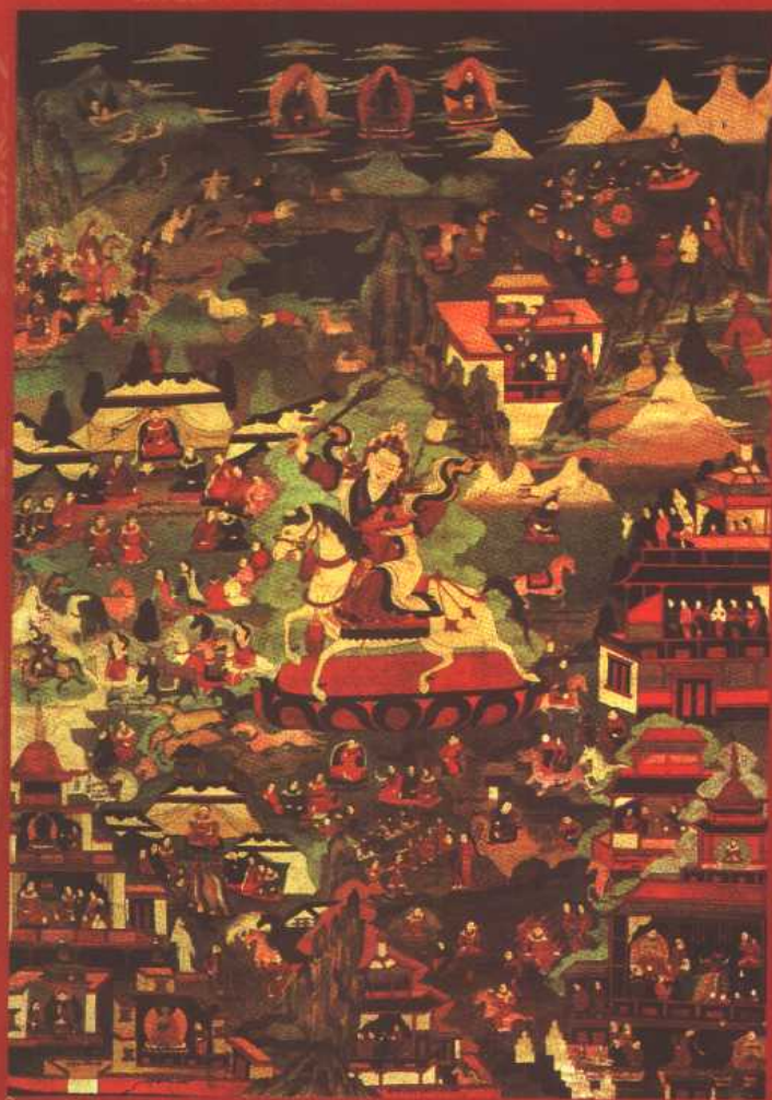
3. 念青唐拉山神，格萨尔的战神之一