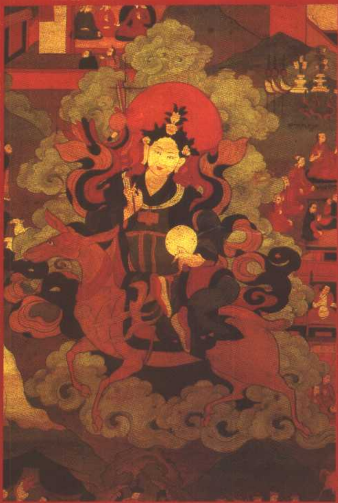
2. 格萨尔王在天界的姑母朗曼杰姆