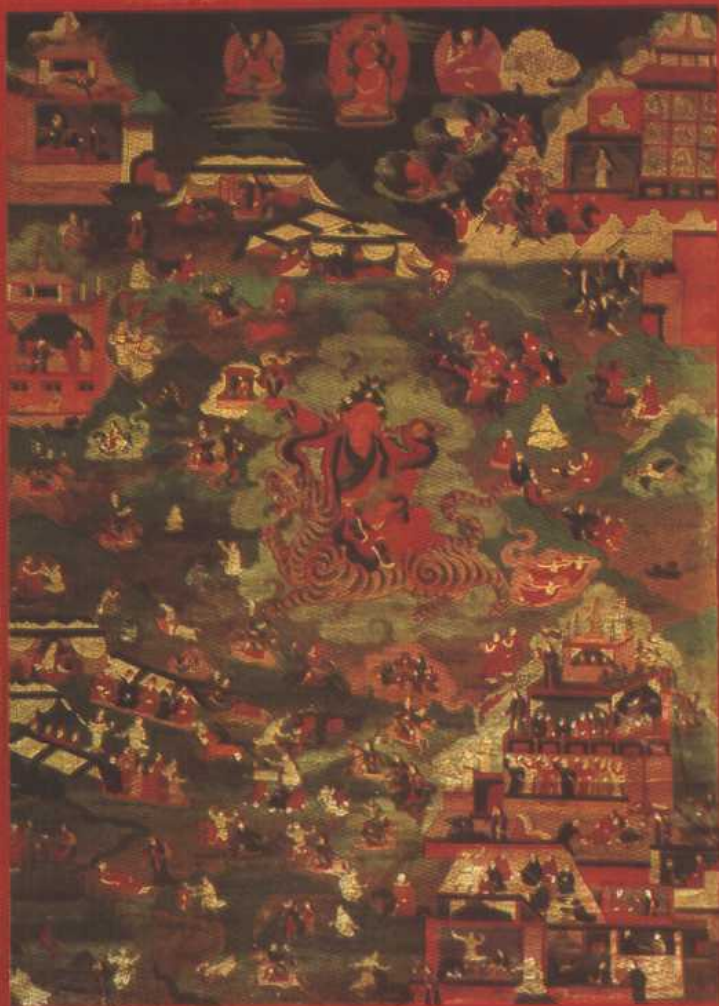
5. 阿尼玛沁山神的化身多吉苏如