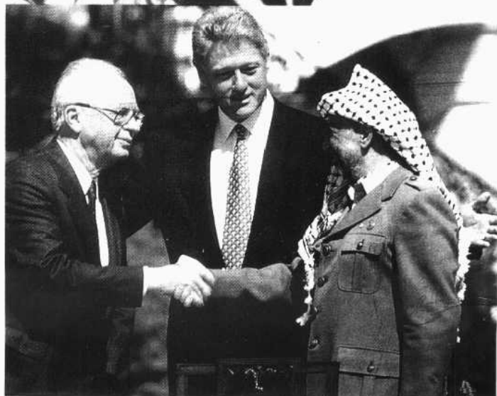
以色列总理拉宾和巴解主席阿拉法特，在和平协议签署后握手。