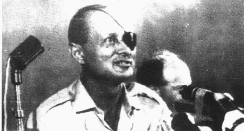
以色列国防部长达扬