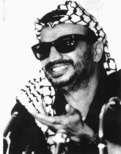
巴解组织领导人阿拉法特