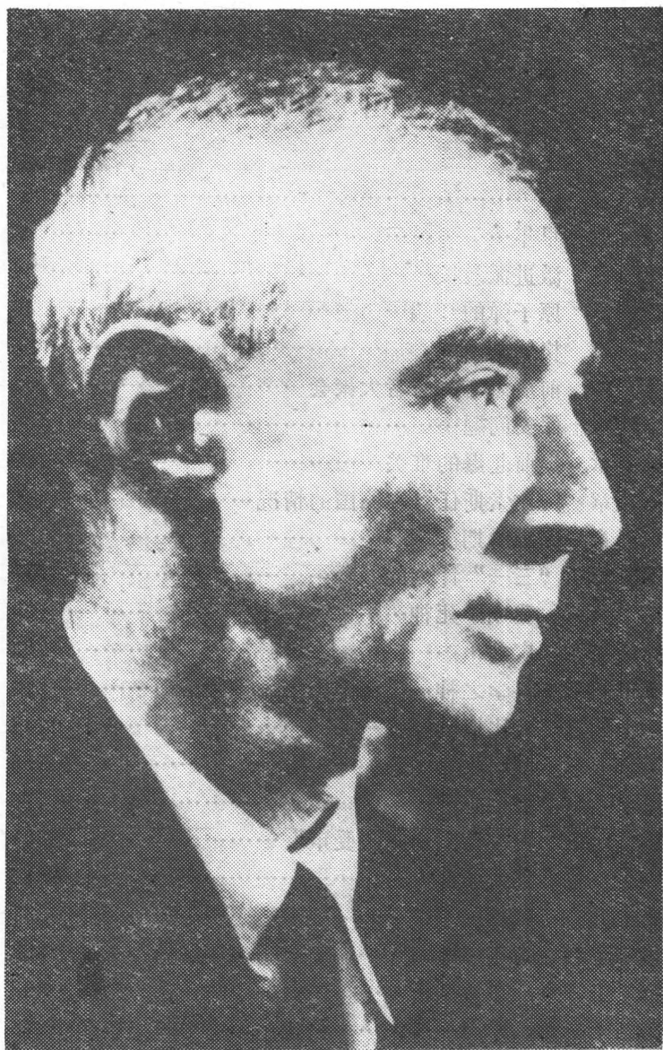
罗伯特·奥本海默肖像