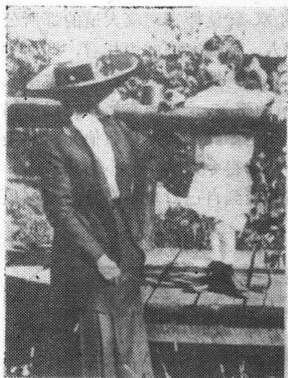
图2 五岁的奥本海默和他的母亲。他的祖父赠送给他一批矿物样品，他从此开始爱好自然科学

他的父亲是……一位非常可亲的人，与人相处时总力图使人愉快，我认为他心地十分善良……。家中的陈设看上去既华丽而又简朴，处处使人感到舒适、入时而令人喜爱……然而总使人觉得又有点感伤，在那里带有一种忧郁的情调。”