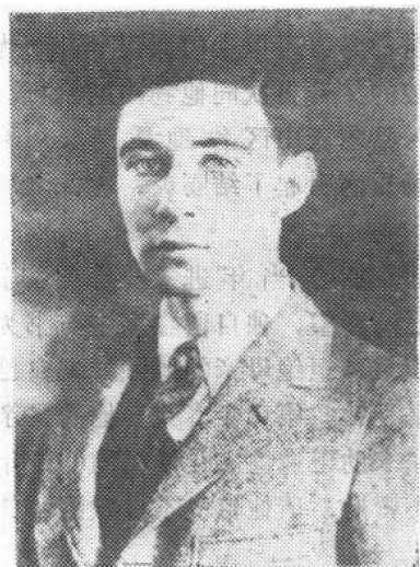
图3 1925年奥本海默在哈佛大学化学系毕业——他在三年时间内修完了四年的课程

伯特·史密斯对这个年青孩子的胆略和精力以及他骑马的天才有了极深刻的印象。奥本海默对于自己的生命危险抱有宿命论的观点，因此他无所畏惧。从体格上看，他长得瘦长而