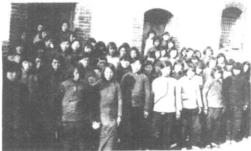
1940年曲阳县妇救会召开村干部训练班