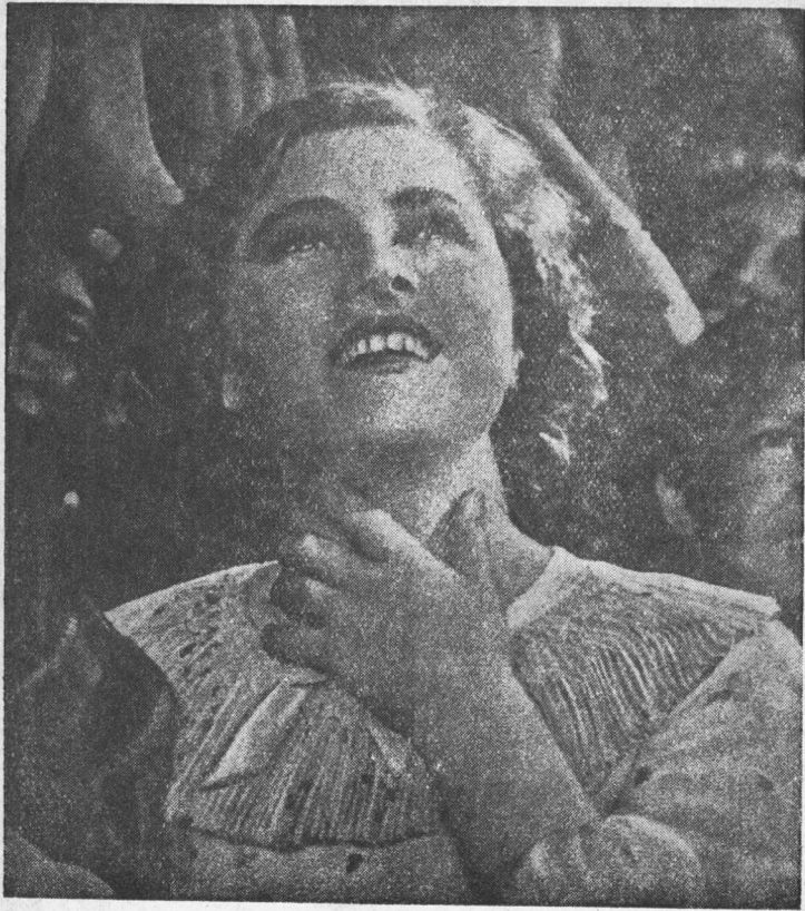
“共 青 城”