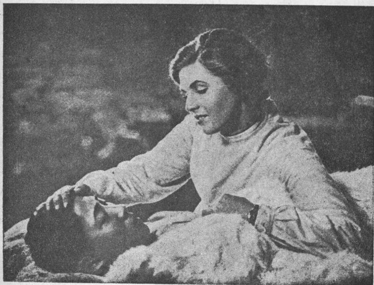
“七 勇 士”