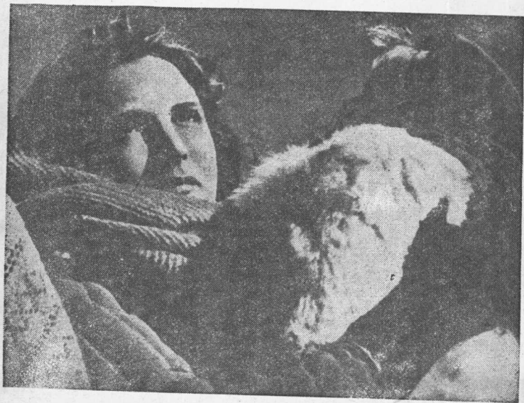
“ 宣 誓 ”