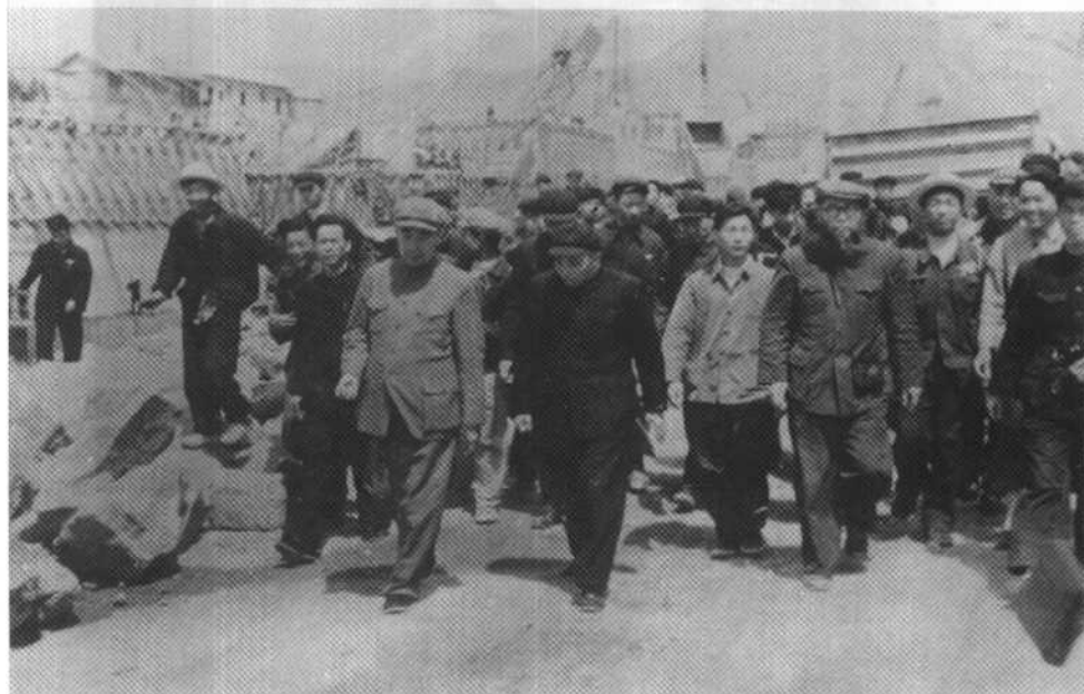
1958年视察三门峡工地。