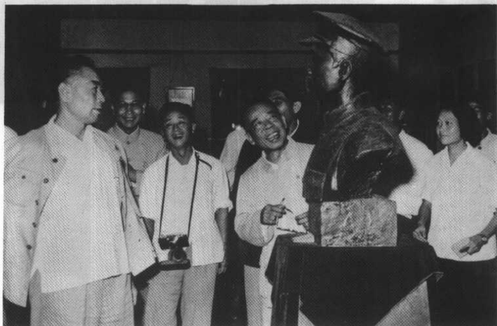
1961年9月18日参观南昌“八一”起义纪念馆。