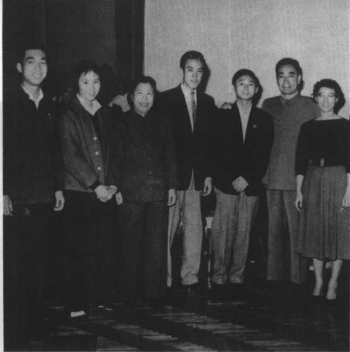
1961年和乒乓球运动员在一起。