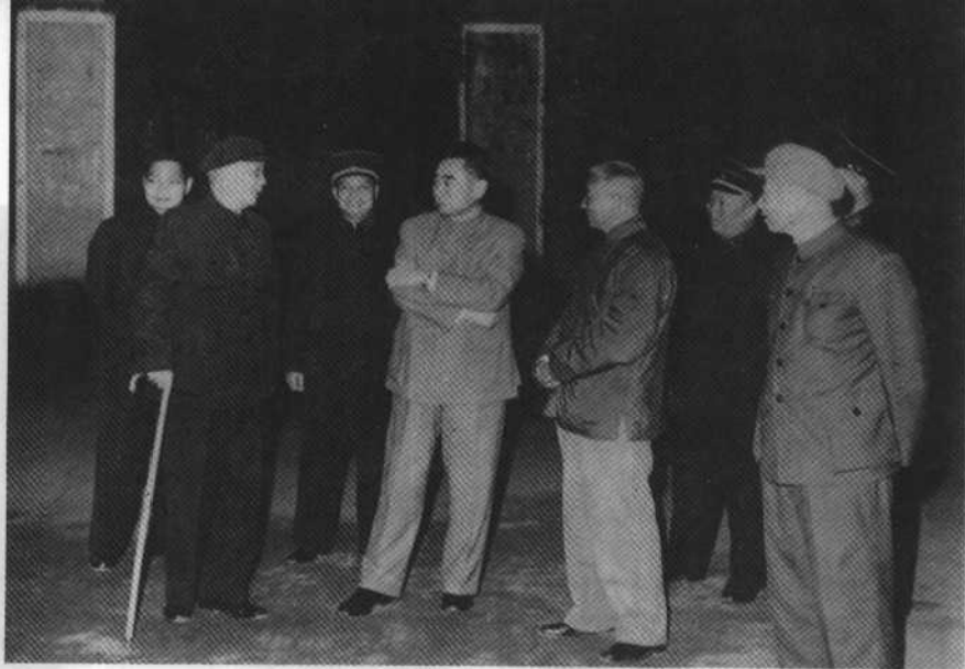
1963年12月6日参观黄埔军校旧址。