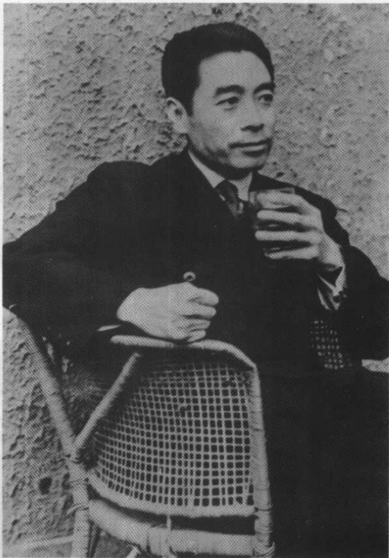
1946年5月在南京中共代表团驻地——梅园新村30号院内。