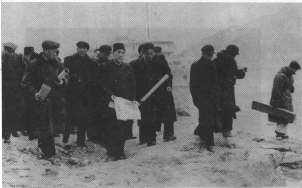
1958年3月视察长江三峡坝址。