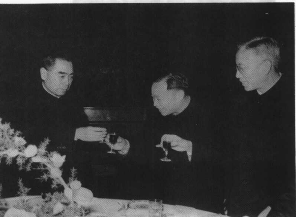
1962年1月5日和科学家在一起。