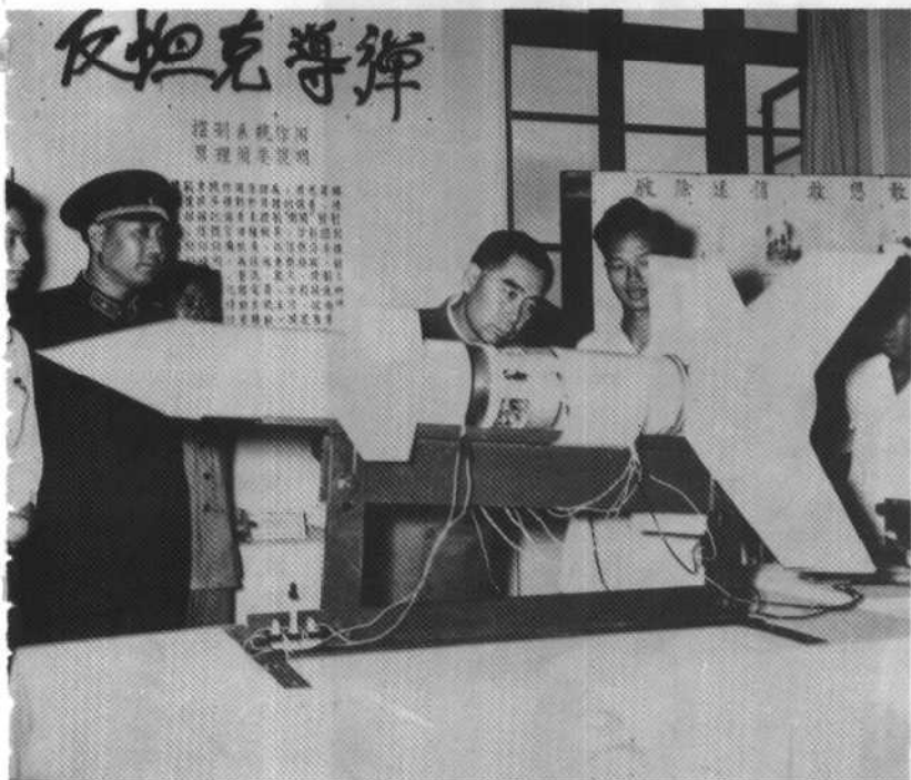
1958年在国防科学技术部门“八一”献礼展览会上，观看反坦克导弹。

敵我坦克在戰場上，常常發生 對峙，雙方都準備射擊，但 往往因距離太遠，未能命中， 以致雙方都受損失。為了 解決這個問題，我們設計了 一種反坦克導彈。這種導 彈，具有射程遠、威力大、 命中準確等優點。它的控 制系統，是由發射器、導 彈、目標指示器、搜索器、 控制站等組成的。發射器 將導彈發射出去，目標指 示器將目標的方位和距離 傳給搜索器，搜索器將這 些信息傳給控制站，控制 站將控制信號發給導彈， 使導彈自動射擊。