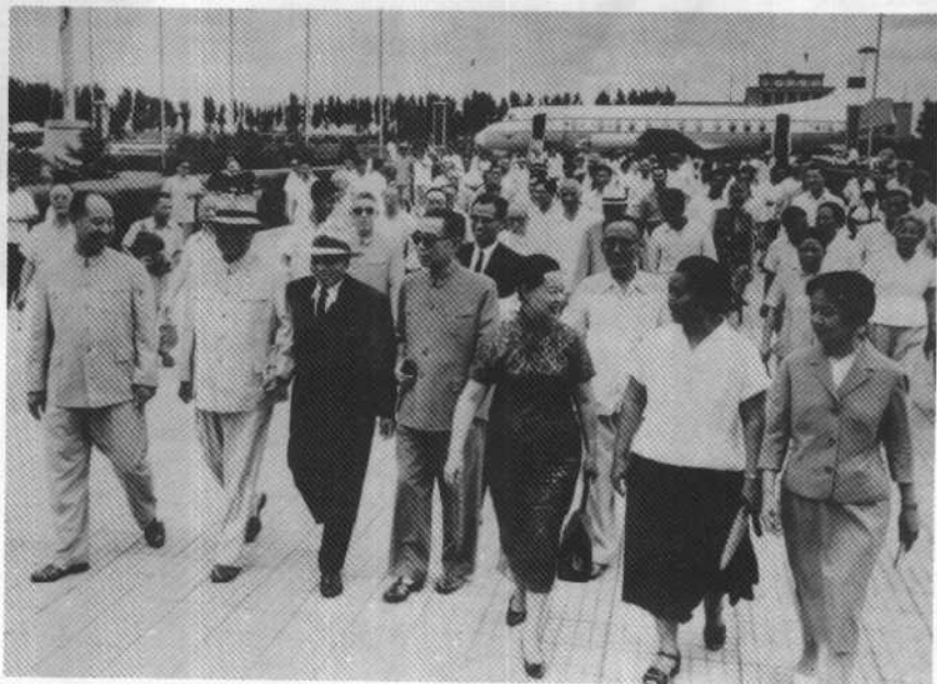
1965年7月20日在首都机场欢迎前国民党政府代 总统李宗仁先生和夫人郭德洁女士从海外归来。