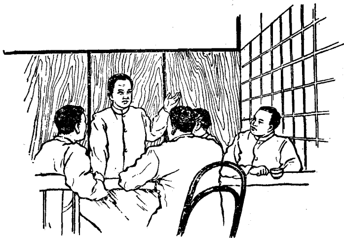
章太炎和中国留日学生谈论当时中国的政治局势

替一家名叫广智书局的书店翻译一些书籍，得点稿费来维持生活。这时，章太炎结识了革命志士秦力山，通过秦力山的介绍，他认识了孙中山。孙中山和章太炎见过几次面，谈过好多话，认为章太炎是一个热心于革命的志士，很敬重他。从此，他们两人就建立了很亲密的友谊。