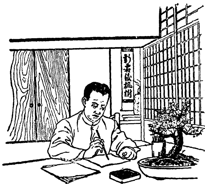
他立刻写了一篇《驳康有为论革命书》

下。1903年，康有为发表了《与南北美洲诸华商书》，公开宣称中国只能实行君主立宪，不能进行民主革命。他恐吓革命派说：革命是一件十分悲惨的事情，它的后果是流血成河，死人如麻，而对于社会来说却没有一点好处。又说：如果革命，必须依靠外国人供给枪械弹药，请外国人帮忙练兵，或者和外国人订立条约，向外国讨救兵，结果就会引来外国人的干涉，弄得亡国灭种。为了避免亡国，倒不如保持原来的君主制度，通过