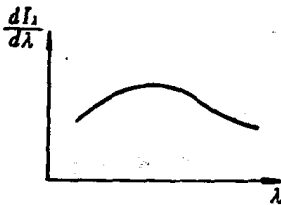
图 0-1 连续光谱

不同的光源有不同的光谱，例如热辐射光源光谱的特点如图 0-1 所示，光强在很大的波长范围内连续分布。这种光谱叫连续光谱。气体(或金属蒸汽)放电发射光谱的特点如图 0-2 所示，光强