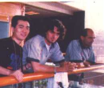
↑ 1995年6月与AC米兰队马尔蒂尼合影。

↓ 意大利球星曼奇尼待人友善，没有大牌球星架子，和他短短两三天交往就成了好朋友。采访结束后，他答应送我一件桑普多利亚队的球衣。