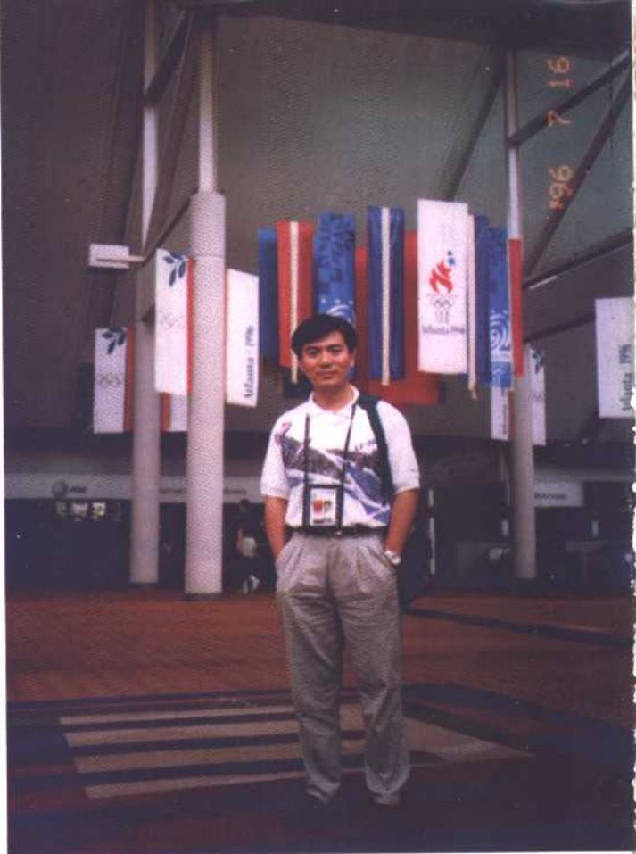
↑ 亚特兰大奥运会期间在国际广播中心留影。

↓ 意大利球星曼奇尼待人友善，没有大牌球星架子，和他短短两三天交往就成了好朋友。采访结束后，他答应送我一件桑普多利亚队的球衣。