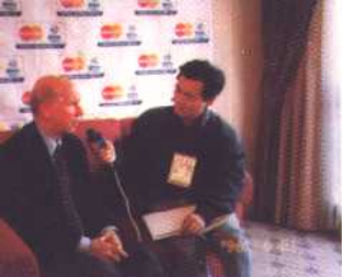
采访足坛名宿 鲍比·查尔顿。