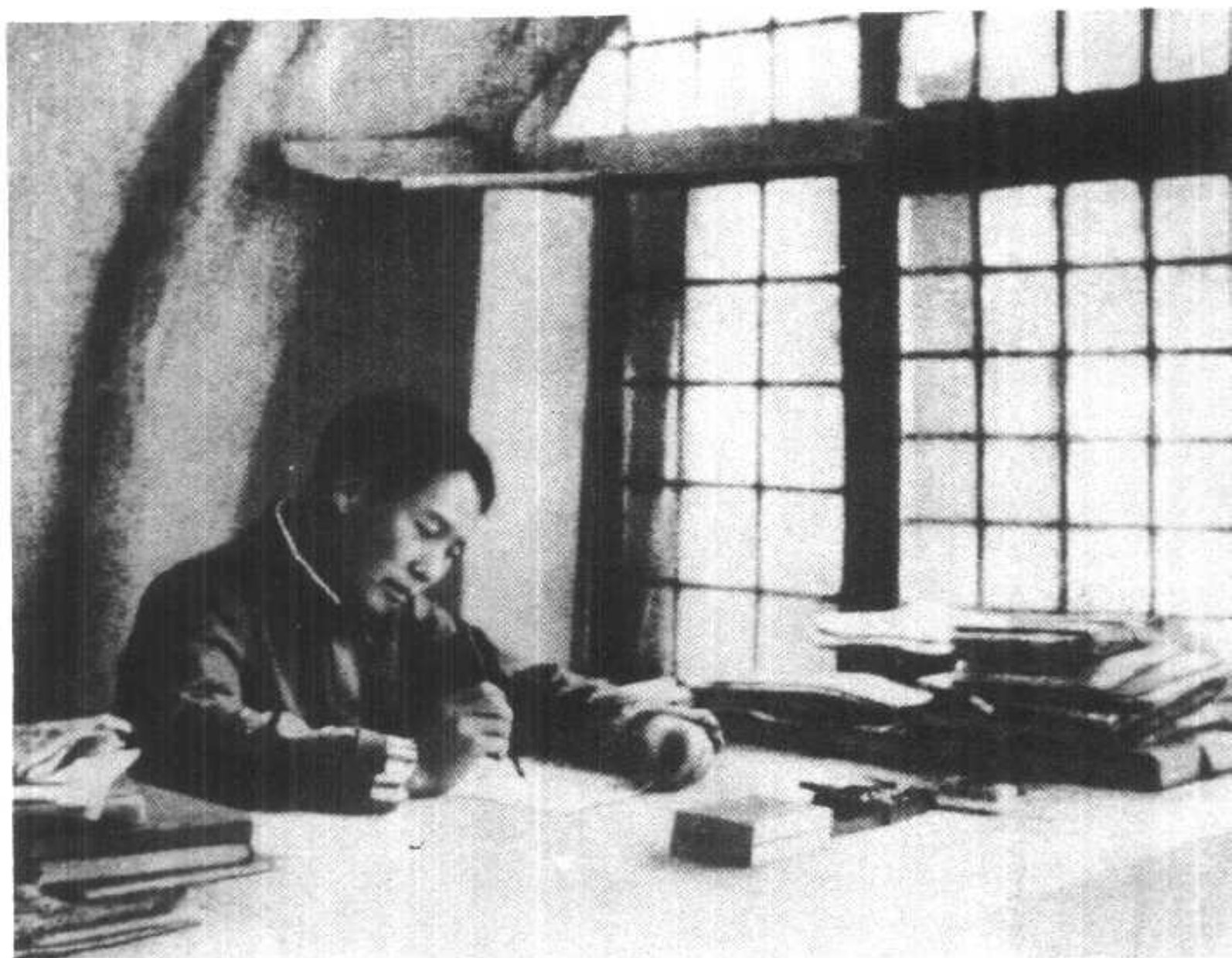
一九三八年，毛主席在延安窑洞中写光辉著作《论持久战》。