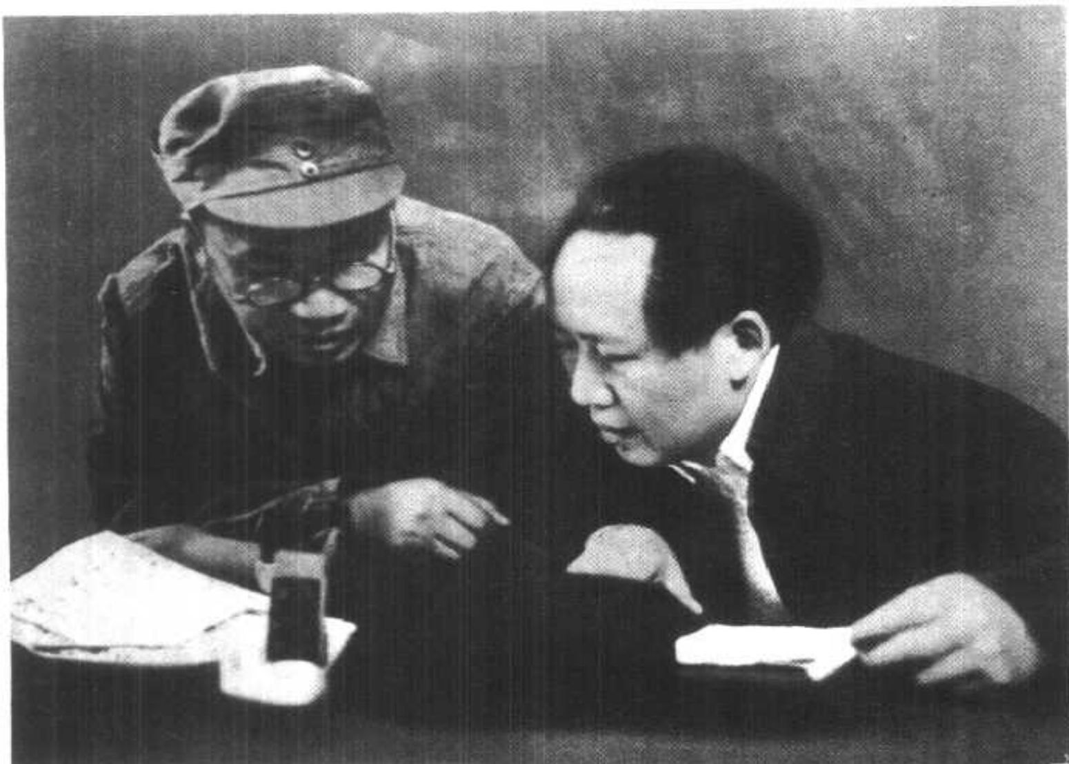
一九四五年，毛主席和朱德同志研究大反攻作战计划。