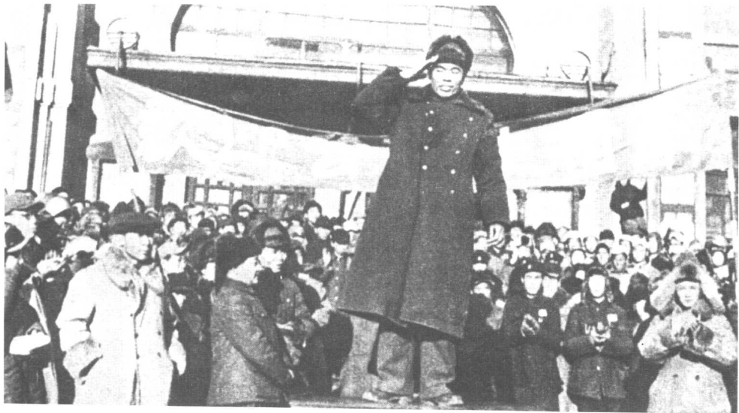
▲ 曾泽生将军在我军欢迎起义大会上讲话。