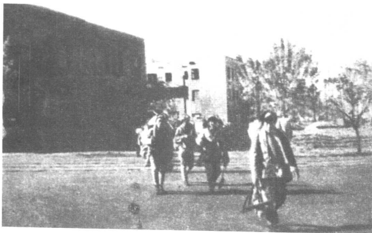
◀ 驻长春的国民党新7军的官兵纷纷向我投诚。