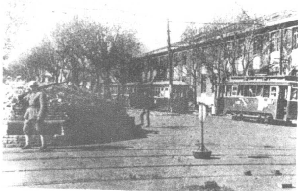
▶ 10月19日长春解放，辽沈战役第一阶段胜利结束。