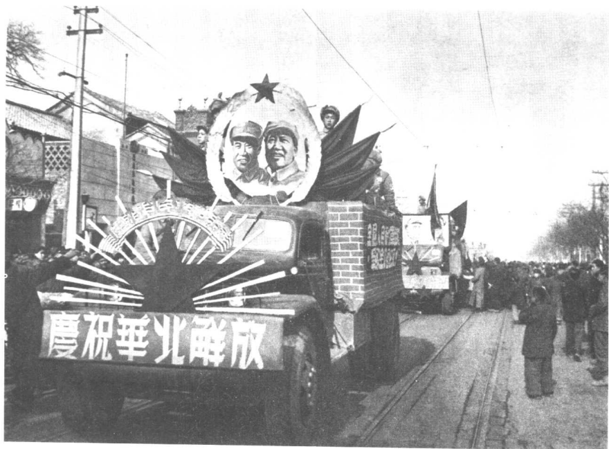
▲ 1月31日，我军在群众欢呼声中进入北平，古都北平宣告和平解放。这是1949年1月31日人民解放军举行入城式。