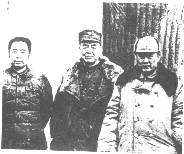
▲ 1949年2月，周恩来（左1）与傅作义（左3）、邓宝珊（左2）在西柏坡合影。