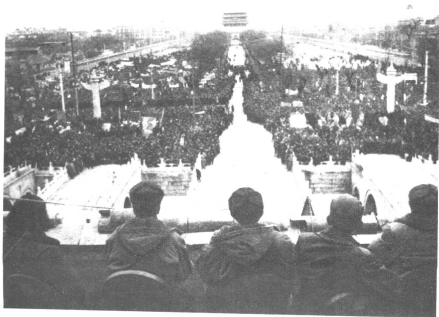
▲ 参加庆祝大会的解放军指战员，在天安门前听首长讲话。