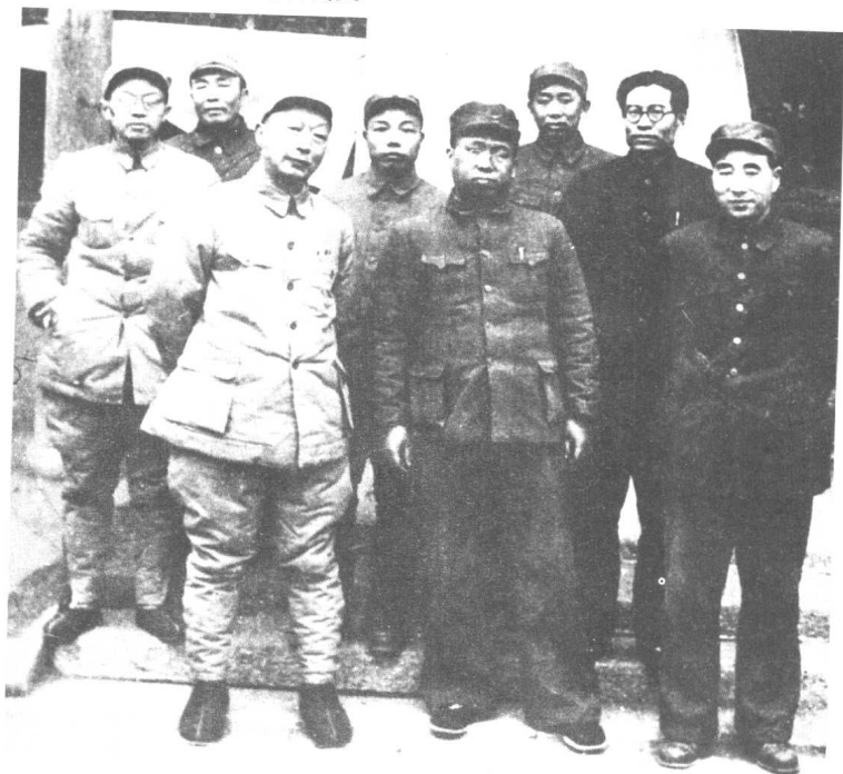
▲ 1948年11月，我军发起著名的平津战役。这是我军前线指挥员林彪（左8）、罗荣桓（左5）、聂荣臻（左3）和黄克诚（左1）、谭政（左2）、肖华（左4）、刘亚楼（左6）、高岗（左7）在平津前线。