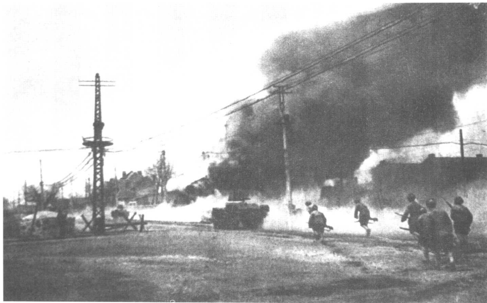
▲ 1949年1月14日，我军对拒绝投降的天津守敌发起总攻。这是我步兵在坦克掩护下冲入市区。次日，天津解放。