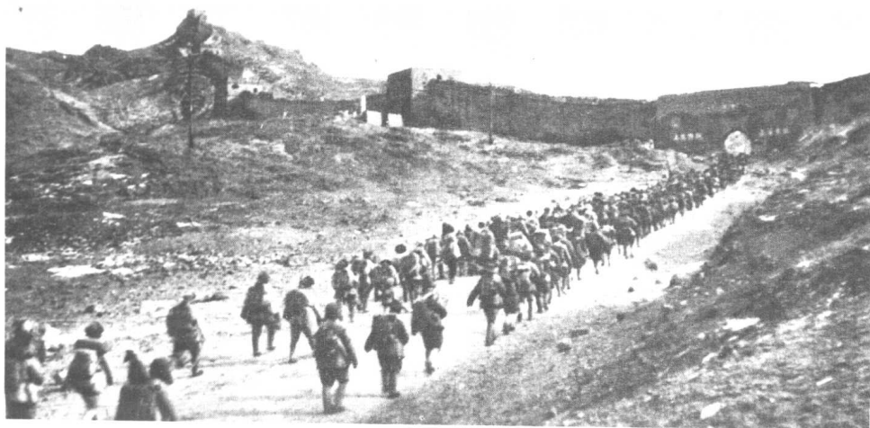
▲ 1949年1月，新保安、张家口解放后，西线的华北与东北部队向平津地区开进。这是两支部队会师八达岭下，并肩通过居庸关。