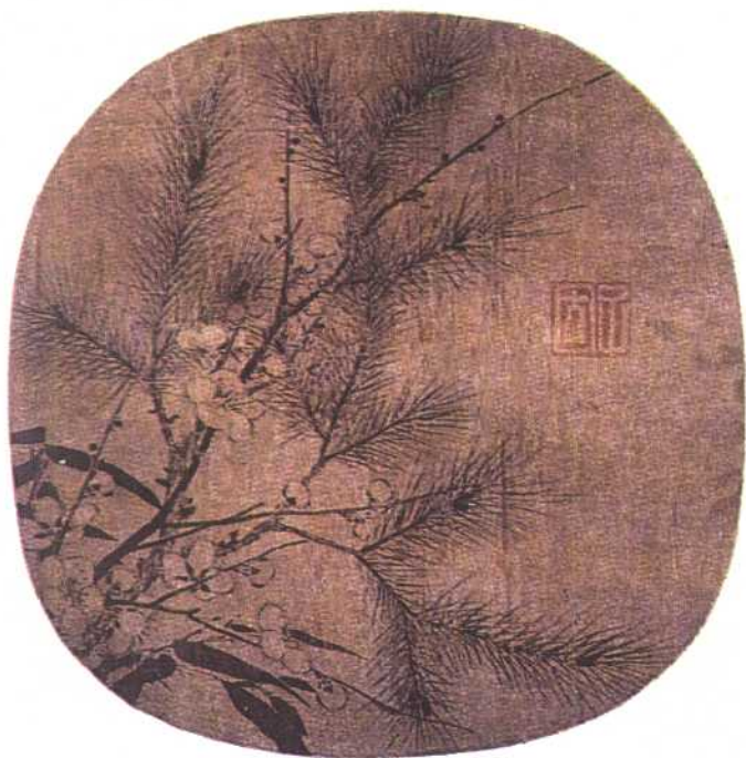
南宋·赵孟坚——岁寒三友图