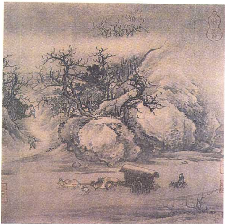
南宋·朱锐——溪山行旅图