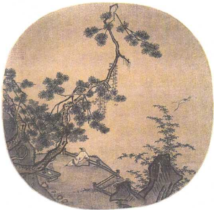
南宋·马远——松下闲吟图