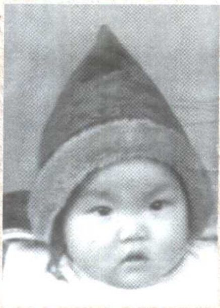
半年以后，我就成了这样一个胖子。