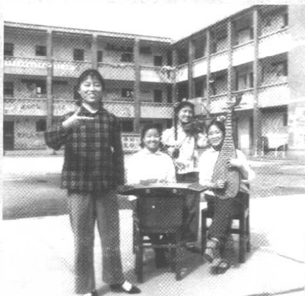
不知是不是因为在宣传队打扬琴的缘故，我顺利地升入高中而没有下乡。