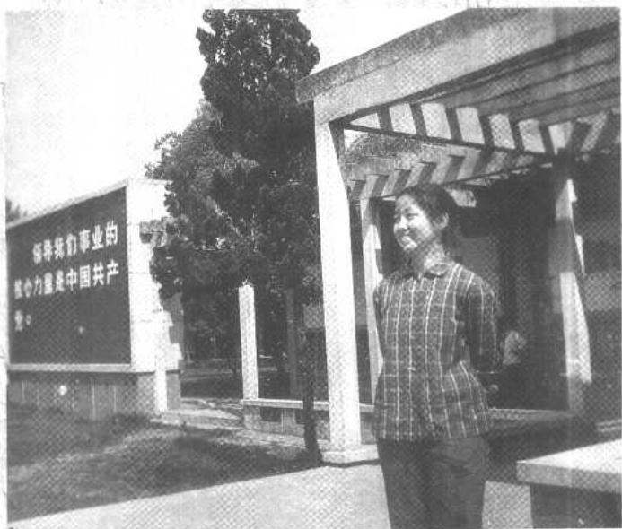
这是七十年代的一个装卸女工，看得出来吗？