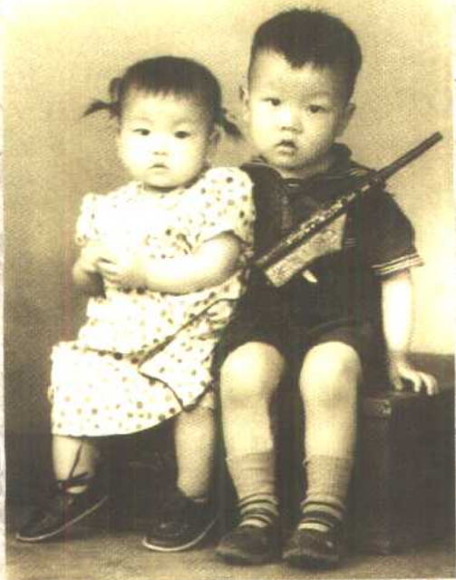
一岁出头的我 和我的小小哥哥在一起