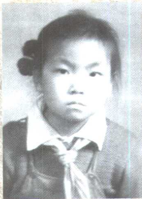
在快满九岁的日子 我加入了少先队