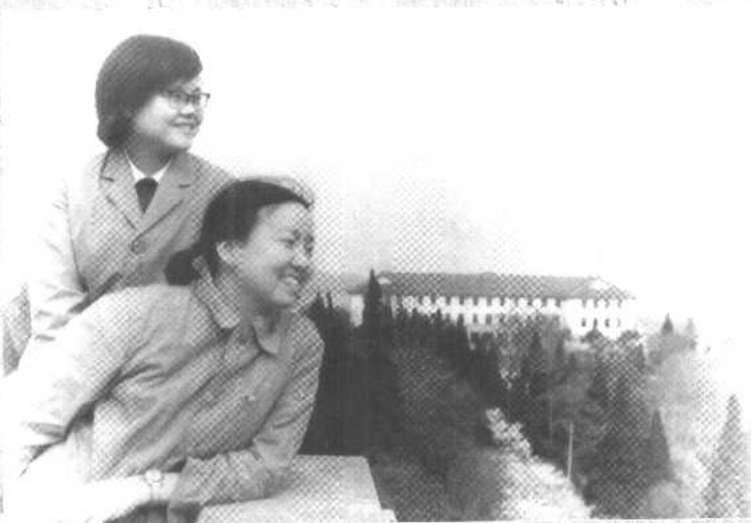
如愿以偿上大学了，多么地意气风发！