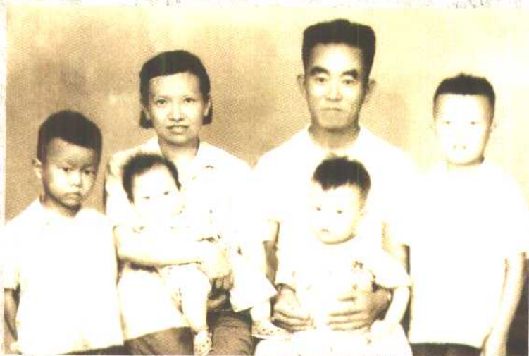
两个月的我，在母亲的怀抱。我的出生使我们全家人数到齐了。