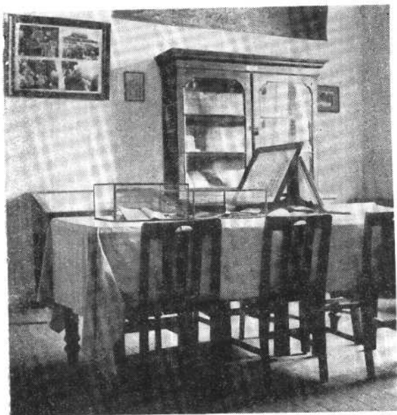
毛泽东同志在一九一八年秋至一九一九年春在北京大学图书馆工作时的工作室。