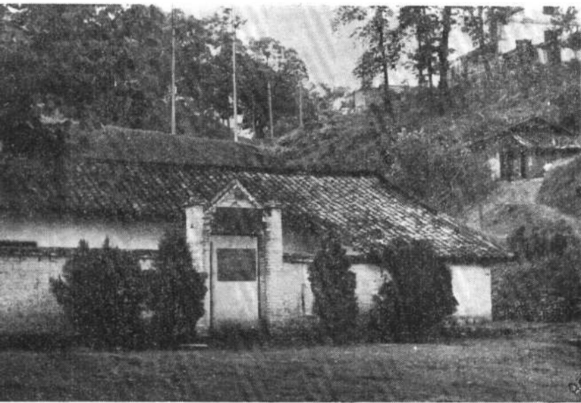
毛泽东同志 一九二一年秋在 安源的旧居八方 井四十四号。