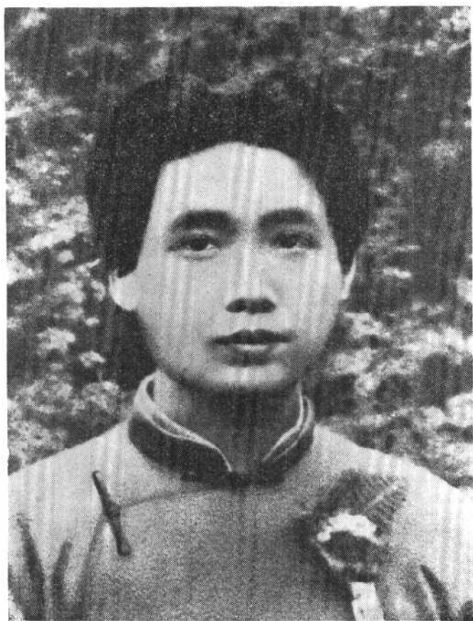
毛泽东同志在上海。