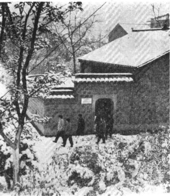
长沙清水塘， 毛泽东同志亲自创立的中国共产党湘 区委员会旧址。