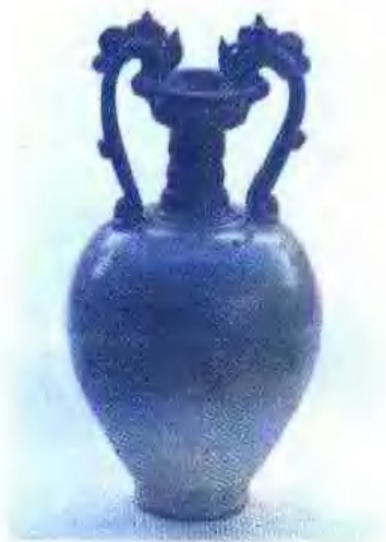
唐青釉双龙柄盘口瓶