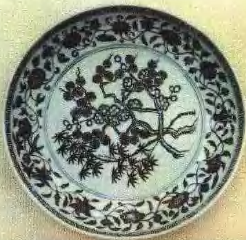
明宣德青花岁寒三友大盘