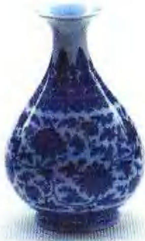
清乾隆款青花缠枝莲纹 玉壶春瓶