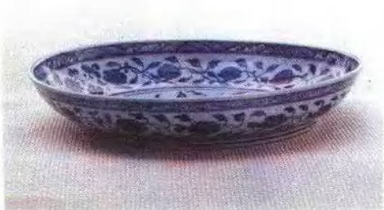
明永乐青花一把莲大盘