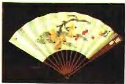
陈半丁中国画扇面