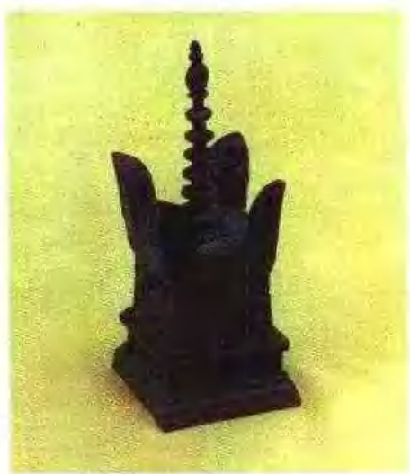
吴越王舍利佛金塗塔