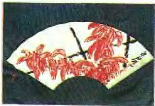
齐白石中国画扇面