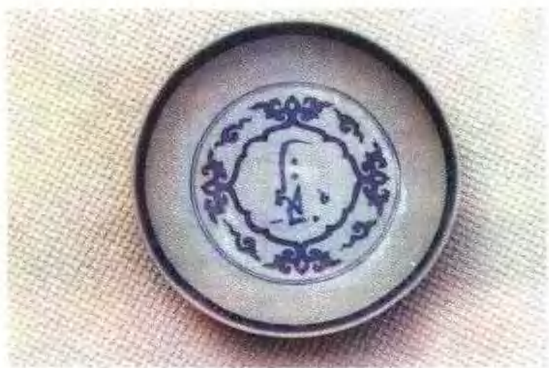
明正德款青花阿拉伯文盘