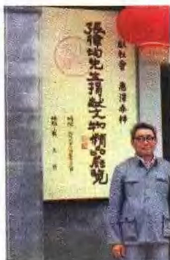
展览在戴王府展出