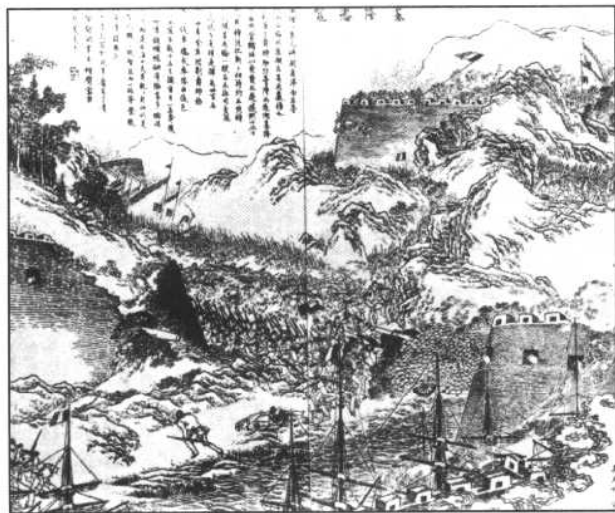
1884年8月，台湾军民在基隆抗击法国侵略军。