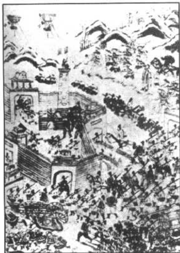
法国为了占据中国西南各省，首先武装进攻越南。图为1884年4月法军侵占越南兴化。