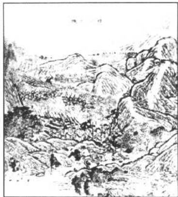
1885年3月，黑旗军在越南临洮大败法军。