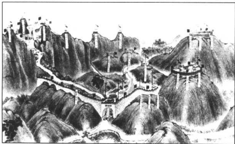
镇南关(今友谊关)清军布防图。