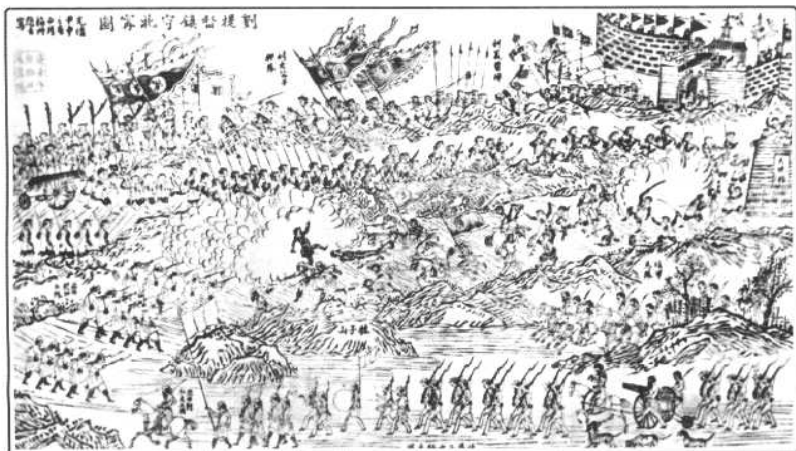
黑旗军镇守北宁图。