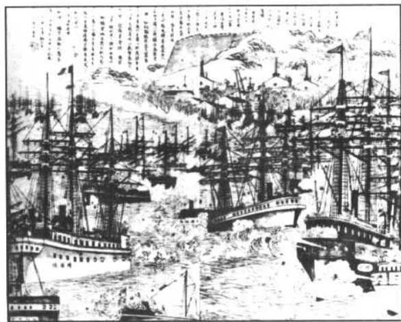
1884年8月，法舰在马尼拉港对中国水师发动突然袭击。