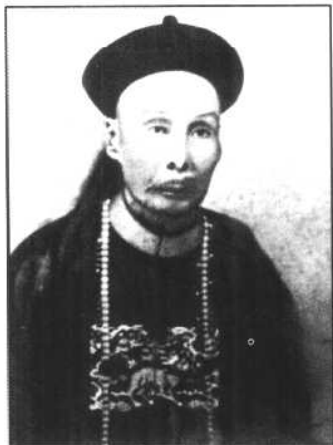
黑旗军首领刘永福。