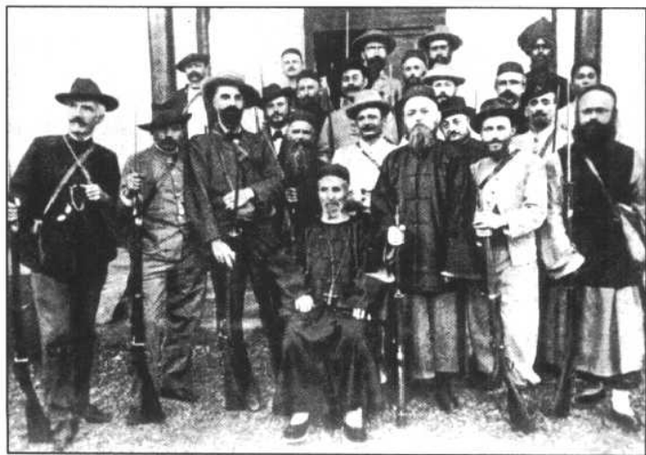
中法战争后，进入云南地区的法国侵略势力。