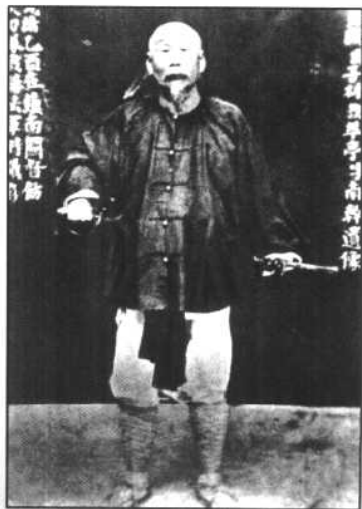
指挥镇南关之役的老将冯子材。