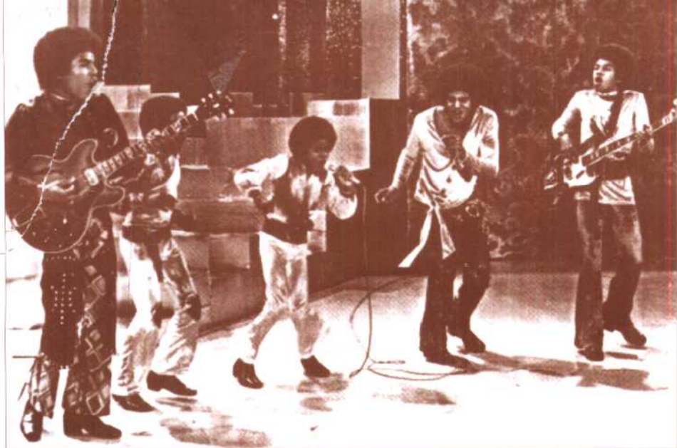
“杰克逊五兄弟”1969年在舞台演唱时的情景。 图中最小的一个即是迈克尔·杰克逊。

莫顿唱片公司的 “杰克逊五兄弟”右 一：杰基，中后：杰 迈思，中前：迈克尔， 左后：泰托，左前： 马隆。（摄于1969年）