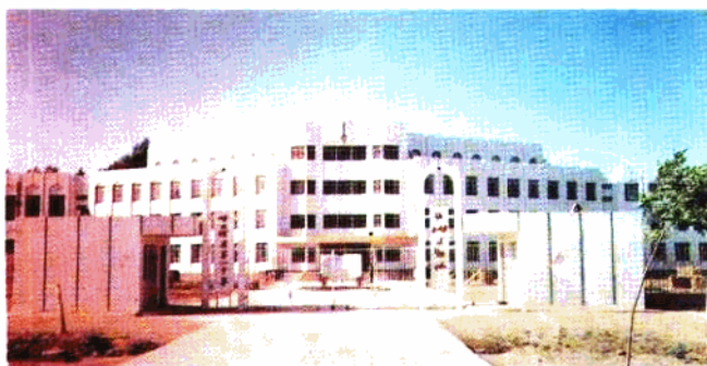
哈巴河县一中校舍