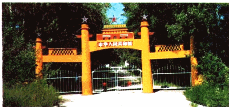
神圣的国门(吉木乃)