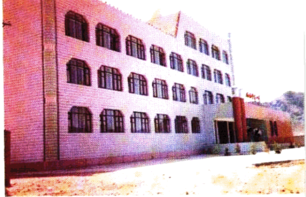
新建的塔克什肯口岸大楼