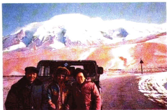
考察途中：作者与塔吉克姑娘在慕士塔格峰下 塔城市中心花坛