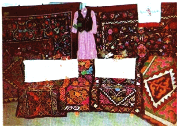
民族工艺品(托里县)