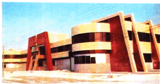
阿拉山口车站外景