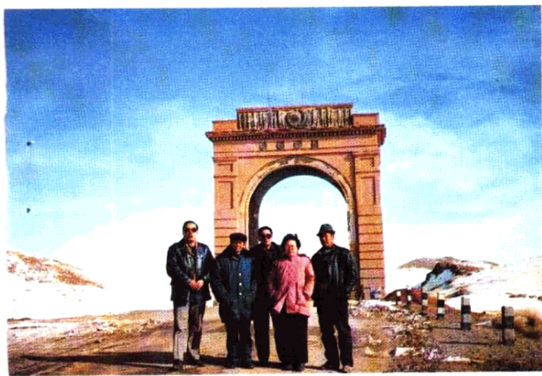
吐尔苏特口岸国门