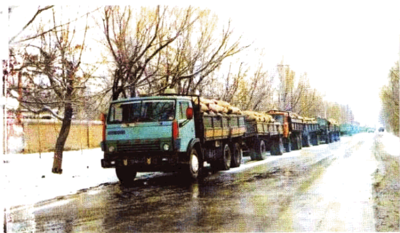
霍尔果斯口岸运输忙