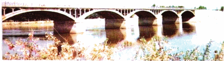
额尔齐斯河大桥(布尔津)