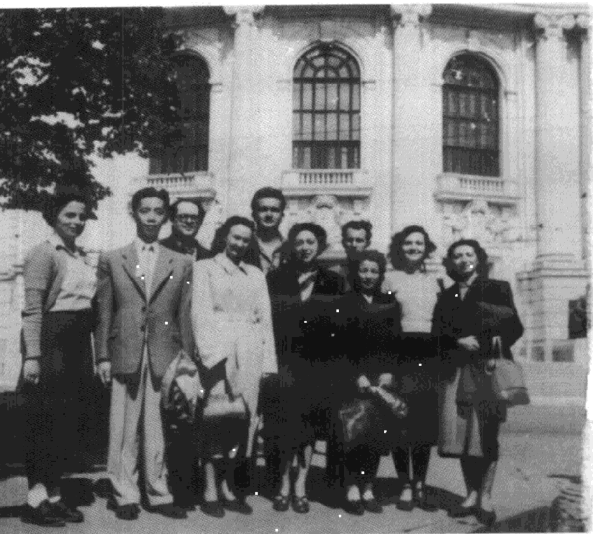
1955年离开保加利亚前与学生合影。