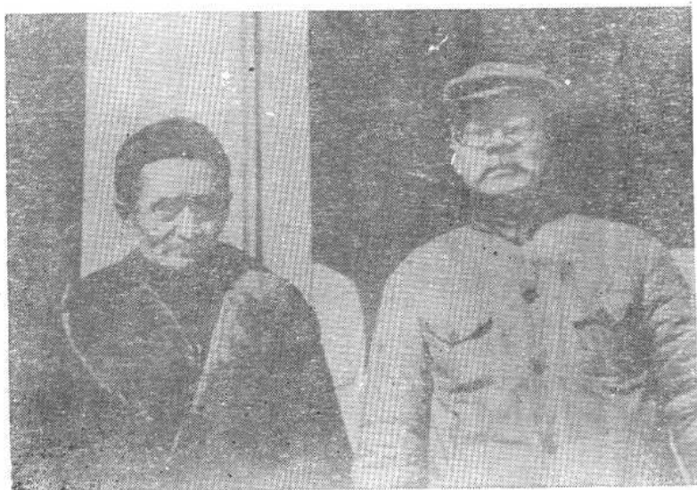
陕甘宁边区政府主席林伯渠和副主席李鼎铭