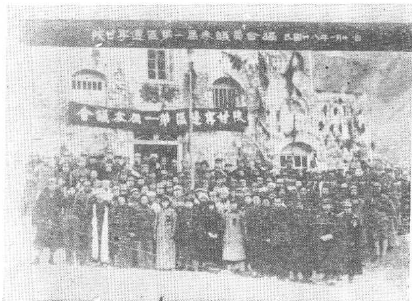
陕甘宁边区第一届参议会全体委员合影