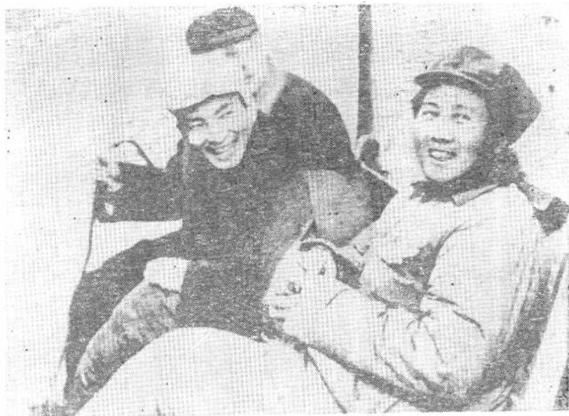
毛泽东、陈云、林伯渠在陕甘宁边区农业展览会休息室