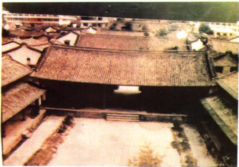
南向宣抚司署旧址,建于1851~1938,系目前国内保存最为完好,规模最大的少数民族土司衙署之一。