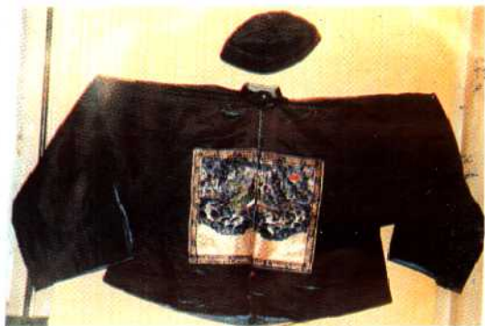
干崖三品文官朝服▽