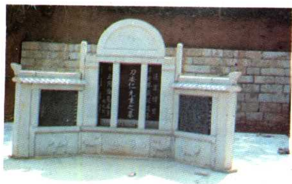
重建的刀安仁之墓