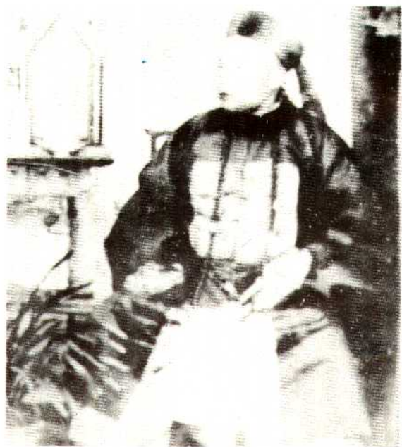
南甸二十七世土司刀定国画像。