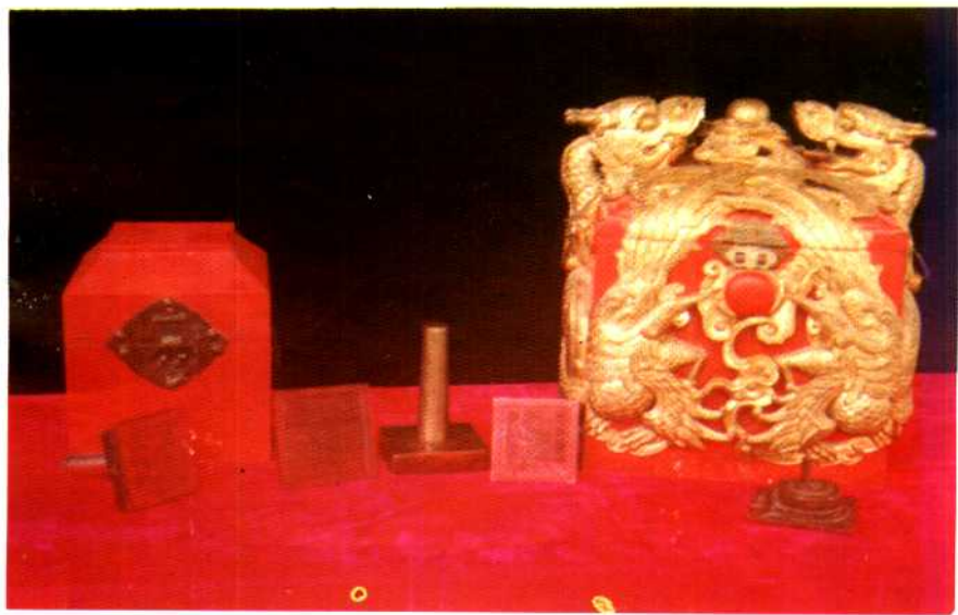
干崖宣抚使司印及印盒。