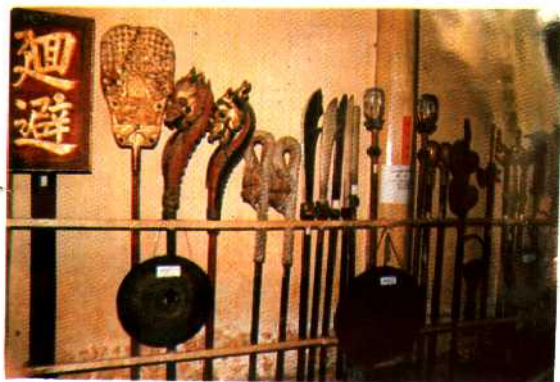
南向宣抚司署仪仗。