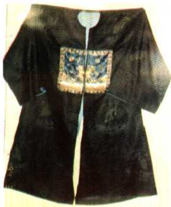
南向二品武官朝服△