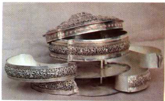
陇川多氏土司妇女用具 —桃形镂金银饰盒▷