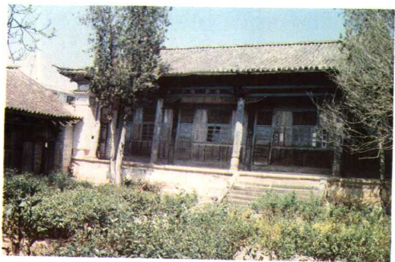
第四进正殿 陇川宣抚司署,始建于清咸丰年间。