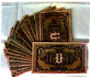
干崖宣抚司发行的 新成银庄银票。