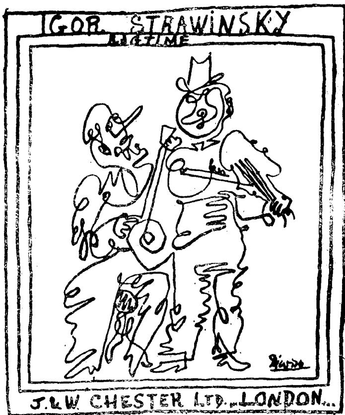
上图是斯特拉文斯基创作的拉格泰姆舞曲集的封面。该封面的设计者是著名画家毕加索，此书在一九一九年由伦敦切斯特公司出版。