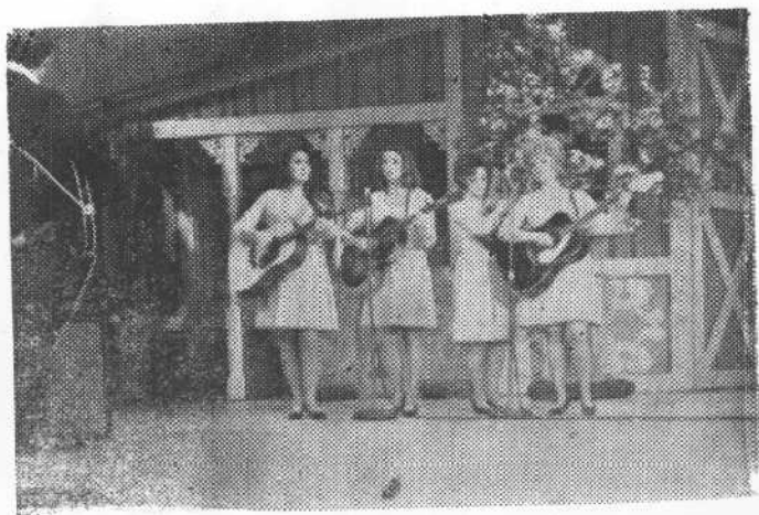
家庭重唱团在表演