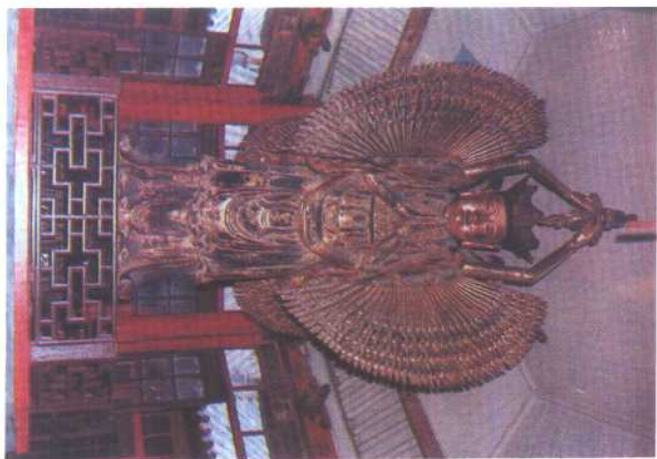
清代千手 千眼观音