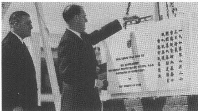
1960年2月，港督柏立基為新大會堂主持奠基禮

本月，香港一批大專學生，就足球博彩事舉行了一次非正式座談會。會後，發言人向記者宣稱，完全同意香港基督教協進會為有關方面擬舉辦足球博彩而向當局提出的抗議。他說，任何形式的猜賭不僅有可能助長犯罪行為，而且沉迷於猜賭的人勢將費時失事，形同慢性自殺，這都是人所共知的。因此，由足球博彩所產生的不良後果是顯而易見的。至於有人說政府可以從足球博彩中取得稅收以便資助香港的社會福利事業，持這種觀點是極為不明智的。故有關當局除了應防止足球博彩被通過成為法案以外，還須通過進一步的立法從法律上取消這項博彩活動。