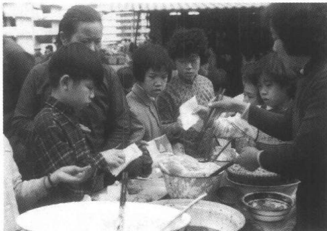
徙置區內的熟食小販