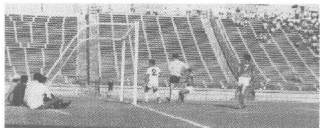
60年代的七人制足球賽

檢舉貪污委員會是專職調查政府公務人員貪污行為的專門機構。在香港，執行調查審核工作的人員，過去只由警務人員負責，今後肅清貪污的責任，其重點將由警務人員以外的非官守議員、由非官守議員選派的人員以委員會的方式處理。但這並不意味着警察權力將全部退出，實際上，基層調查、執行的工作仍由警務人員分擔。