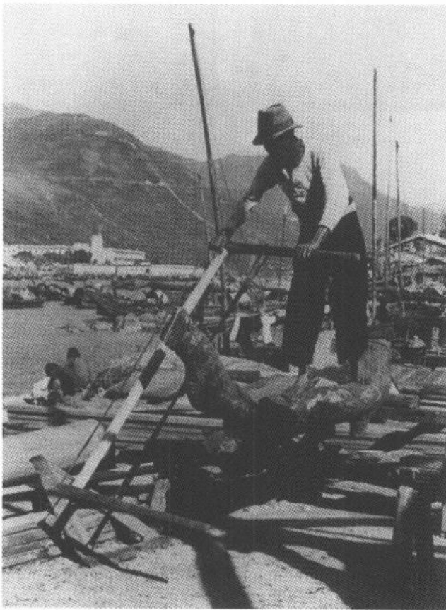
60 年代香港造船業正在起步

本月，港府海事處處長柏赫在工作報告中稱，截至本年第一季底為止，香港共有機動漁船 2729 艘。該季內，共有 3026 艘船艇及漁船由海事處牌照所發給及換發牌照，其中包括 19 艘機動貨船，562 艘機動漁船，以及 214 艘汽艇。同時，有 49 艘船隻因改變其註冊類別，被取銷牌照。其中有十艘因改裝為貨船而重新註冊。在塔門到平洲之間行駛的小型輪渡新航綫，已經獲准發給臨時牌照。新界其他各處，仍有小型機動漁船，在離島各鄉村及墟鎮間行駛，成為主要交通工具。