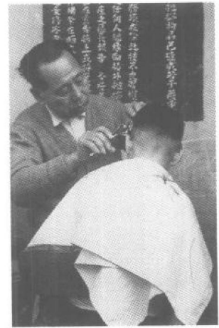
60年代的街頭理髮攤