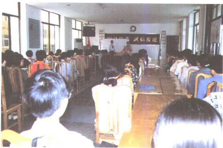
每周晨会部分职员听取业务讲座