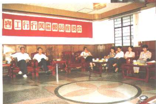
市工商银行坚持数年的行风评议活动