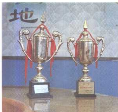
1995年荣获全国土地复垦先进单位