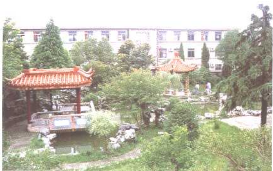
市高级中学校园一角