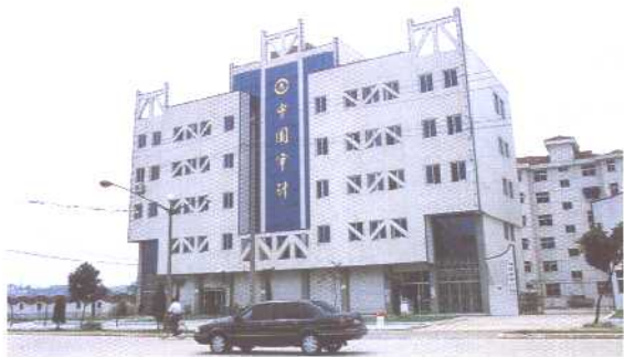
市审计局办公大楼