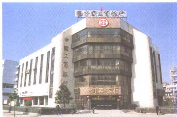
市工商银行办公楼