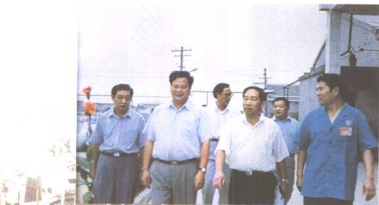
镇江市委书记方之焯等领导来厂视察

镇江市东昌石油化工厂是专业生产石油化工产品的企业，拥有一流的生产设备和雄厚的技术力量，先进的工艺流程和检测手段，年生产能力达10000吨。该厂不断完善质量体系，强化质量监督检查，基本上形成了从原料进厂到产品交付全过程的质量检测网络。产品远销新疆、内蒙古、辽宁、广东、河南、河北、山东、浙江、江苏、上海等全国二十多个省、市、区的近百家客户和独联体，深受用户欢迎。