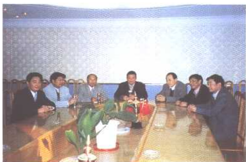
国土局领导在研究工作