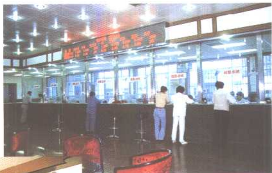
市工商银行中街营业部