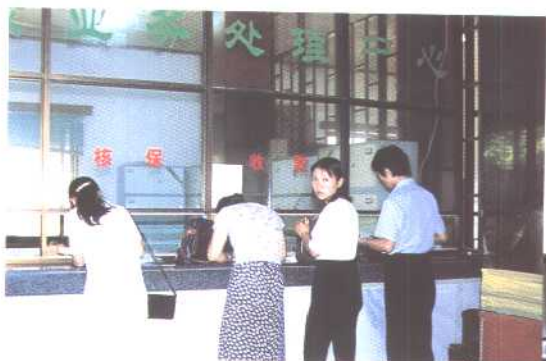
人寿保险业务处理中心一角