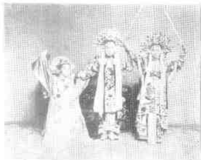
《张恨水》： 上海的新女校 演出《张恨 水设计剧，而 她在场表演 员》 诗老